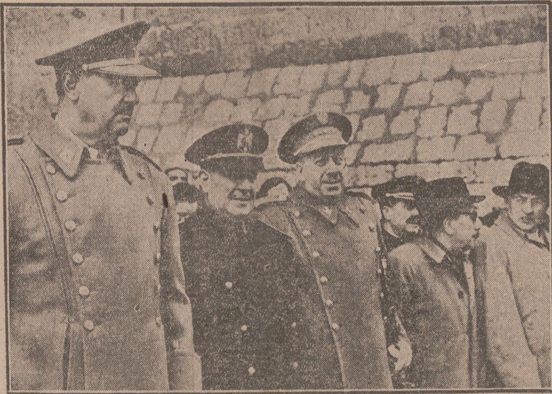
El Capitán General de la Región, con el Gobernador Civil y Jefe Provincial, y acompañados de las primeras autoridades, presenciando el desfile de las fuerzas de Infantería, que celebraron ayer la fiesta de su Patrona.