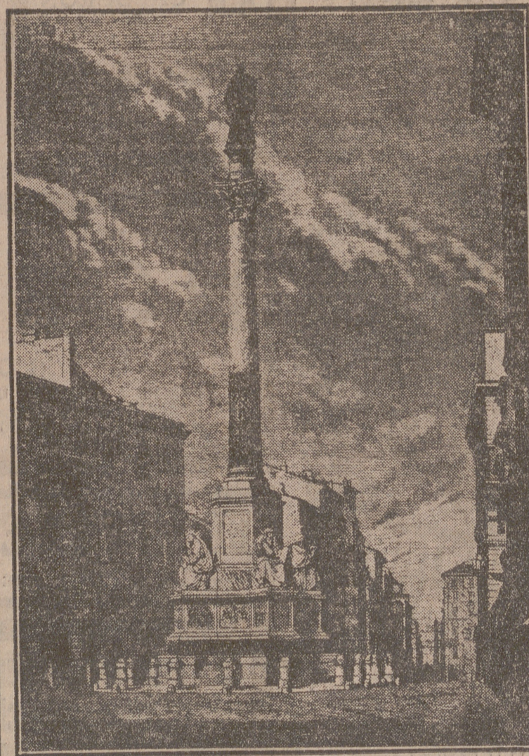
He aquí el monumento erigido en la Plaza de España en Roma, ante el cual Su Santidad el Papa ha rendido homenaje a la Inmaculada Concepción.