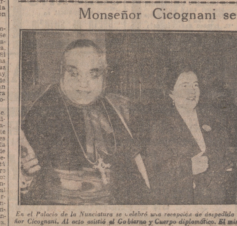
En el Palacio de la Nunciatura se celebró una recepción de despedida al Nuncio de S. S. en Madrid, monseñor Cicognani. Al acto asistió el Gobierno y Cuerpo diplomático. El ministro secretario asiste a la despedida.

—No sólo no sería apropiado, sino sumamente inconveniente. En 1934, gran número de periódicos españoles publicaron una nota redactada por José Antonio Primo de Rivera en la que rehusaba terminantemente la invitación para asistir a un Congreso internacional fascista que se celebraba a la sazón en Montreux y al que había sido invitado, y aprovechaba la ocasión para declarar que "Falange Española de las J. O. N. S. no es un movimiento fascista. Va perfilándose cada día con caracteres peculiares, y está segura de encontrar precisamente por ese camino sus posibilidades más fecundas".