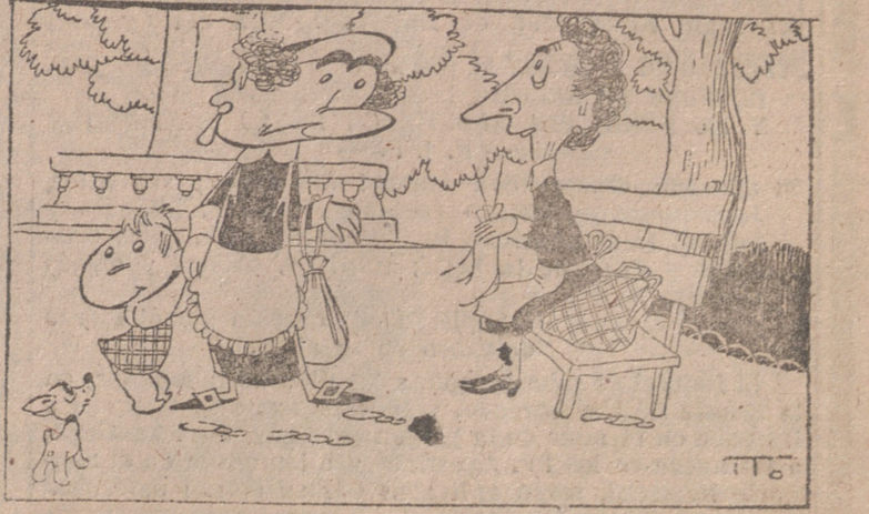
—Si, antes era eso, pero desde que está el tiempo así, soy ama seca.