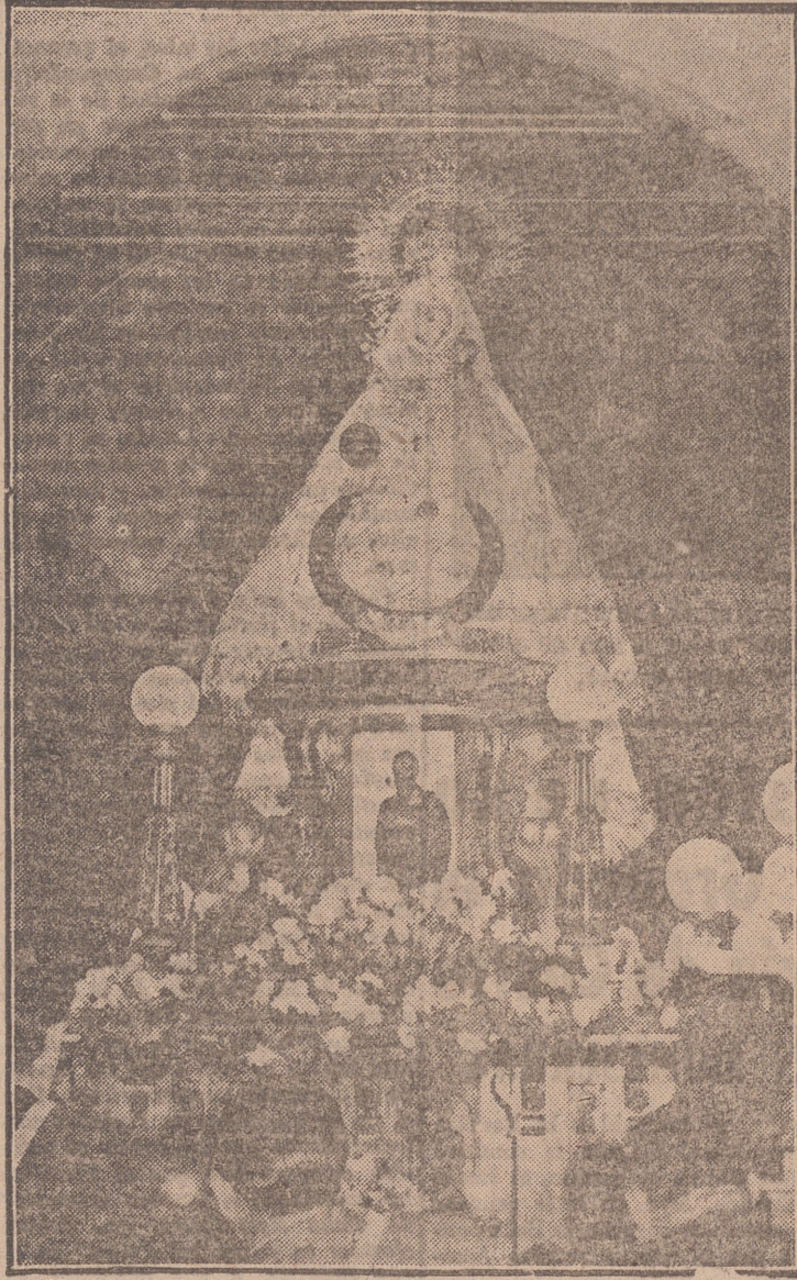
La imagen de la Patrona de Valladolid sale de su templo.

Con motivo de la festividad de Nuestra Señora de San Lorenzo, Patrona de la ciudad, el día de ayer en Valladolid tuvo un marcado aspecto mariano. Por la mañana, desde las primeras horas, la Iglesia parroquial donde se venera la sagrada imagen estuvo concurridísima de fieles