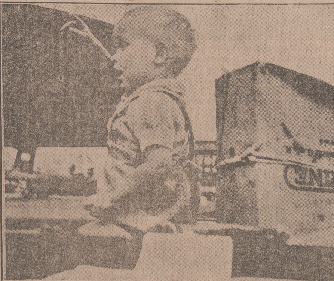
Un millar de niños berlineses han pasado sus vacaciones de verano en ciudades marítimas del Oeste, invitados por el Gobierno de la Alemania Occidental. En la "foto" se ve a uno de estos pequeños esperando la partida del avión que le llevará de nuevo a casa.