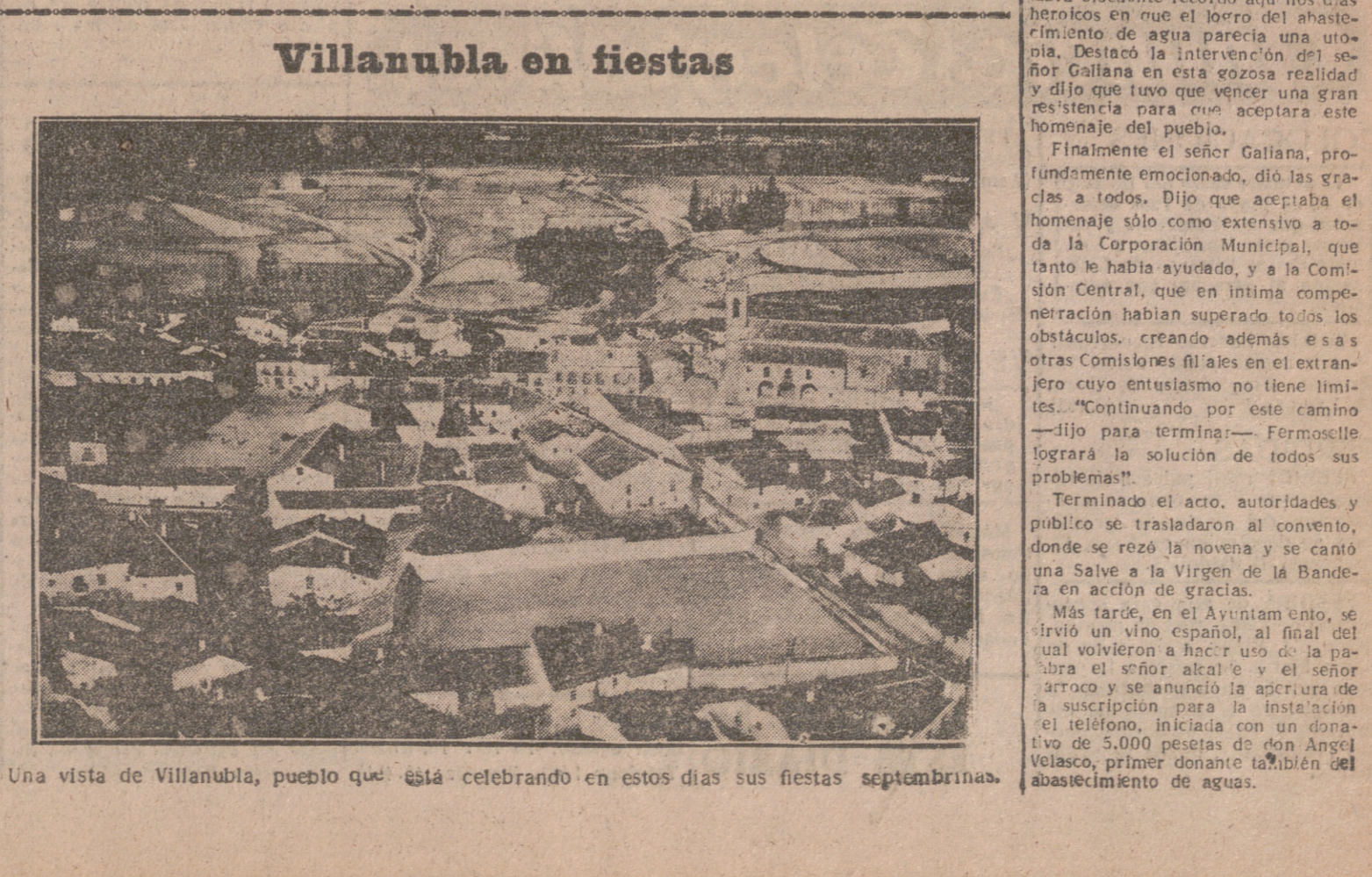
Una vista de Villanubla, pueblo que está celebrando en estos días sus fiestas septembrinas.

He aquí cinco libros interesantes publicados por "INSTITUTO EDITORIAL REUS": Aguilar Caballero: "Manual de urgencia para el hogar" (con 21 figuras), 25 pesetas. J. Sandoval: "Comed naranjas. La naranja, alimento; la naranja, medicamento" (2ª edición), 20 pesetas. Doctor A. Box: "¿Desea criar niños sanos?" Maternidad y Puericultura. Ilustrado con grabados, 50 pesetas. J. Jara: "Más de 2.500 refranes relativos a la mujer" (soltera, casada, viuda, suegra), 50 pesetas. E. Chicote: "Las señoritas de Panpinea" (relato retrospectivo y folletinesco. Recuerdos y anécdotas), 50 pesetas. "INSTITUTO EDITORIAL REUS". Preciados, 6 y 23.—MADRID