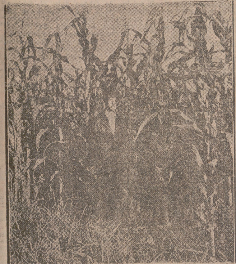
MAIZ HIBRIDO, EN SEVILLA.—A pesar de la gran altura que suelen alcanzar estos maíces híbridos, su tallo fuerte y flexible unido a sus potentes raíces, hacen prácticamente imposible que se tumben o encamen.

Su rendimiento, mediante semillas selectas, puede llegar a 5.000 kilogramos por hectárea