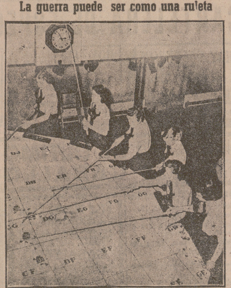
Estas lindas acroupiers de la R. A. F. operan sobre un tapete con más colores que el verde de los casacaes. Señalan la posición de escuadras aéreas durante unas maniobras. ¿Verdad que las manitas parecen un fuego de azor?

roca. Queridos compatriotas, escuchad: Soy un militar y un fiel patriota. Cierta número de traidores, como Fatemi (ministro de Asuntos Exteriores con Mussadeq), desean vender nuestro país a los extranjeros. Los monárquicos iranes han derrocado al Gobierno demagogo, a través del cual gobernaba Hussein Fatemi. La nación, los oficiales y la Policía han tomado la situación en sus manos. Zahedi asumirá su puesto de primer ministro. No hay razón para alarmarse. Conservad la calma.—Efe.