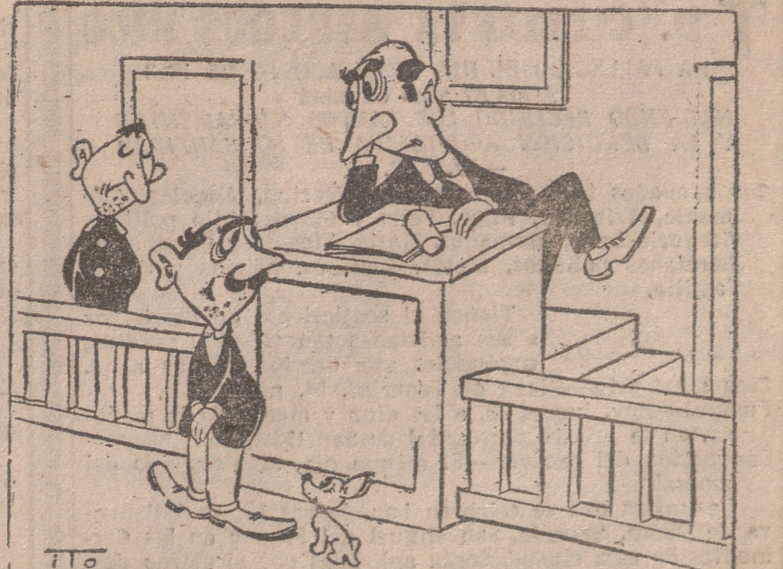
—En confianza: le felicito por haber "calentado" a su suegra. Cumplirá un día menos seis meses.