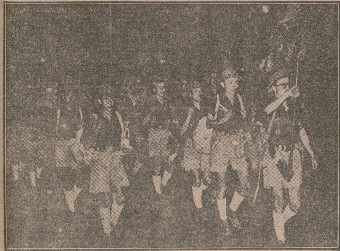
Con la alegría del deber cumplido desfilan por Madrid los camaradas de la Centuria "Gibraltar", después de haber abierto durante su periodo campamental 200.000 hoyos, en los que serán plantados otros tantos árboles que, al cabo de pocos años, convertirán uno de los paisajes más áridos del cerco madrileño en frondoso lugar de esparcimiento.