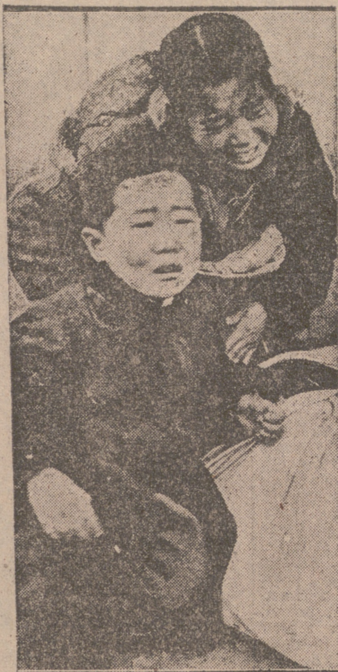
De un rincón al otro del mundo, los políticos, más o menos bien intencionados, aceptan, rechazan o aplazan conferencias. Discuten o hacen hablar a las armas. Y cuando la voz de los que sufren las consecuencias de sus egoísmos o de sus errores se alzan, quedan sorprendidos, como si alguien quisiera perturbar, sin derecho, su estúpido sesteo.

En este caso, he aquí una estampa de Corea, el pueblo que ha sufrido las "pasadas" de unos y otros y se halla sumido en la miseria y en la desesperación.