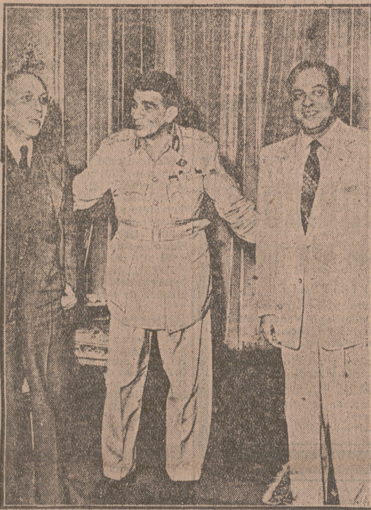
El presidente de la República egipcia, general Naguib, saluda a los jefes de los Gobiernos de la India (a la izquierda) y Pakistán, que recientemente coincidieron en El Cairo. Los tres hombres de Estado trataron del problema del Canal de Suez.

MENSAJE COMUNISTA AL MANDO DE LAS N. U. Aceptando la reanudación de las negociaciones de tregua