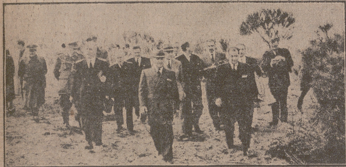
Huelva.—Su Excelencia el Jefe del Estado, acompañado del ministro de Agricultura y otras personalidades, durante su visita a las zonas de repoblación forestal de Almonte y Bonares.

Ayer inauguró una nueva sala en el Museo de Bellas Artes y visitó el Hospital de la Caridad. Los sevillanos continúan manifestándole su fervorosa adhesión