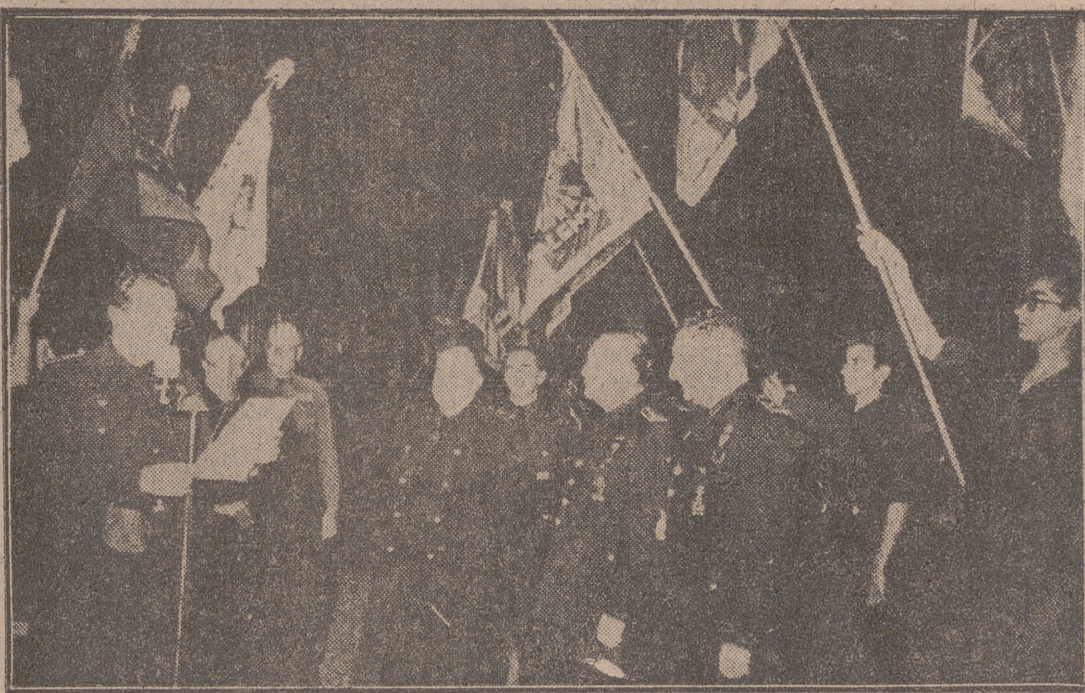
Valencia.—El señor Fernández Cuesta, acompañado del gobernador civil de la provincia y del delegado nacional de Excautivos, escuchan la Oración de los Caídos después de la ofrenda de coronas ante la cruz que perpetúa la memoria de los mártires.

“La generación del 36 hizo posible una España nueva, mejor y más digna”