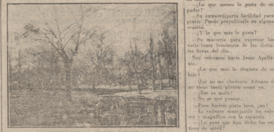
Un paisaje nevado, de Jesús Apellaniz.

El primero gana más que el segundo, pero vende menos