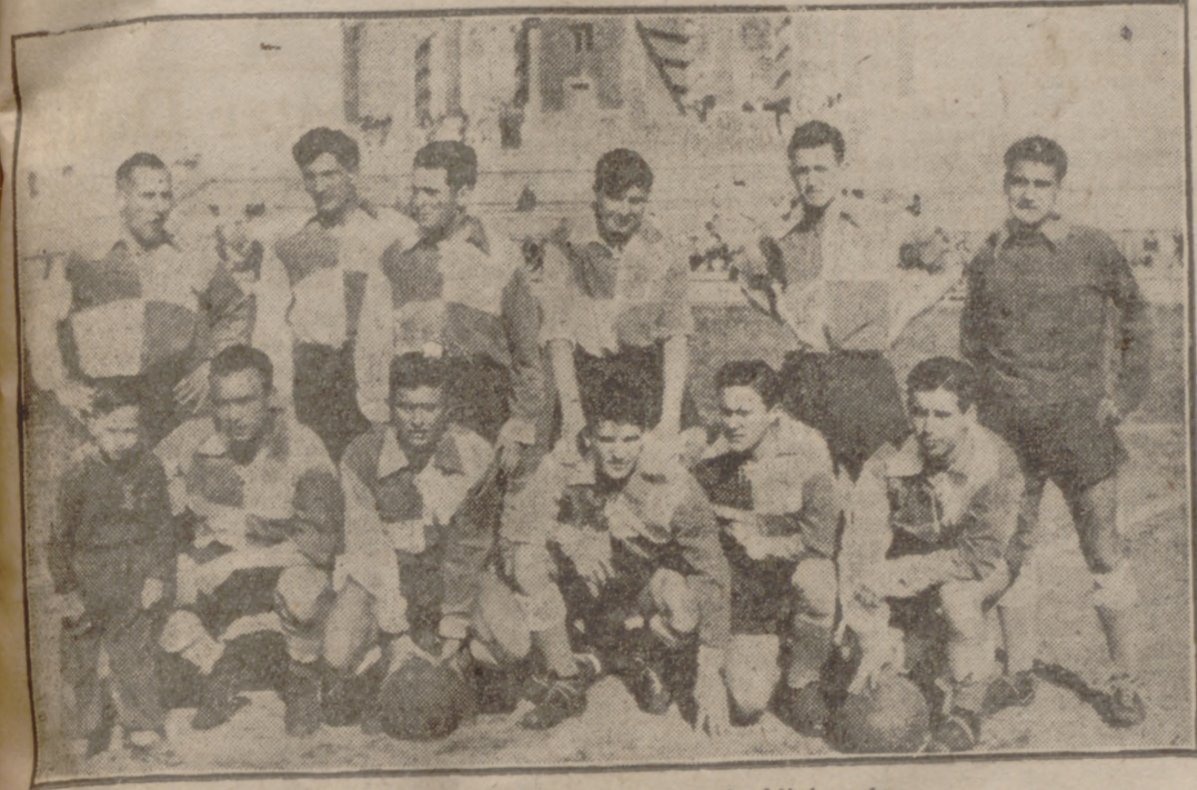
Equipo del Júpiter-Luises, campeón de Aficionados.

En un mal partido venció al R. E. N. F. E. por tres-cero