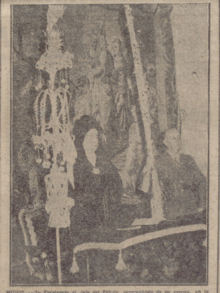
MADRID. — Su Excmo. el Jefe del Estado, acompañado de su esposa, en la capilla de palacio durante la solemne misa celebrada con motivo de la festividad del Domingo de Ramos.

Respecto a la segunda nota de la Alcaldía autorizando la circulación de vehículos por la población desde las diez y media de la noche del Jueves hasta las dos de la madrugada del Viernes Santo, nos atrevemos a decir que no es motivo suficiente la celebración de los conciertos de música sacra —no demostrada sacra, por cierto— para legitimar semejante autorización. Creemos que los asistentes a los conciertos no se han de hermanar por hacer a pie la distancia que hay de su casa al teatro. Si quiera una vez por año conviene pasar un poco, y más si se hace como penitencia en el corazón de la Semana Santa. Y que los taxistas nos perdonen si estas líneas les causan algún malestar o perjuicio. Pero entendemos que no hay mejor coche para el Jueves que el de San Fernando; ese que obliga a todos a ir unos ratos a pie y otros andando.