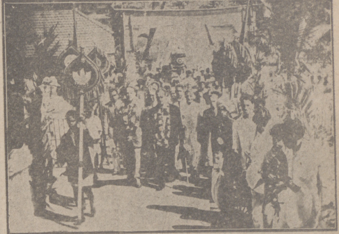
GOA (India portuguesa). — Los ministros de España y Portugal, señores Iturmendi y Cavaleiro, durante su visita al templo hindú de Harguesh, uno de los más ricos de esta ciudad.