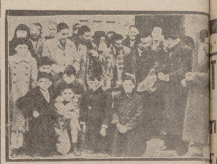
Los afiliados a la Organización Nacional de Ciegos y a la de las Modistas, en el acto religioso celebrado ayer en la iglesia de San Ildefonso...