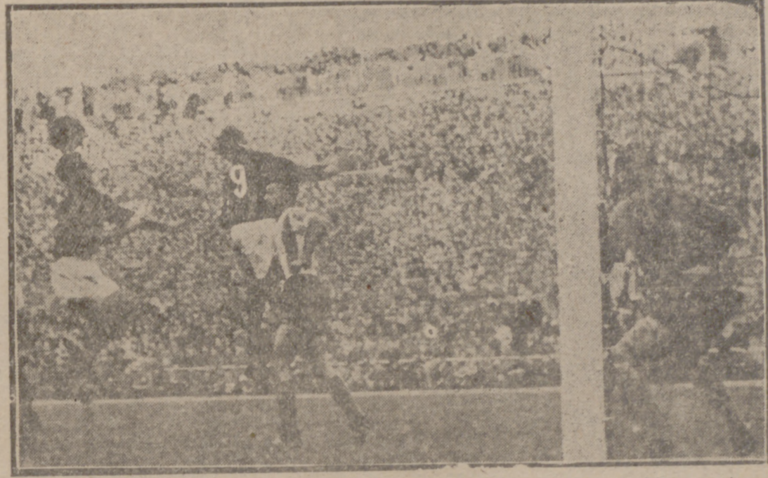
Un centro de Basora rematado por Marquet, sin consecuencias, porque el caialán no estuvo acertado en la ejecución.

(Crónica de nuestro crítico deportivo LUIS ANGEL)