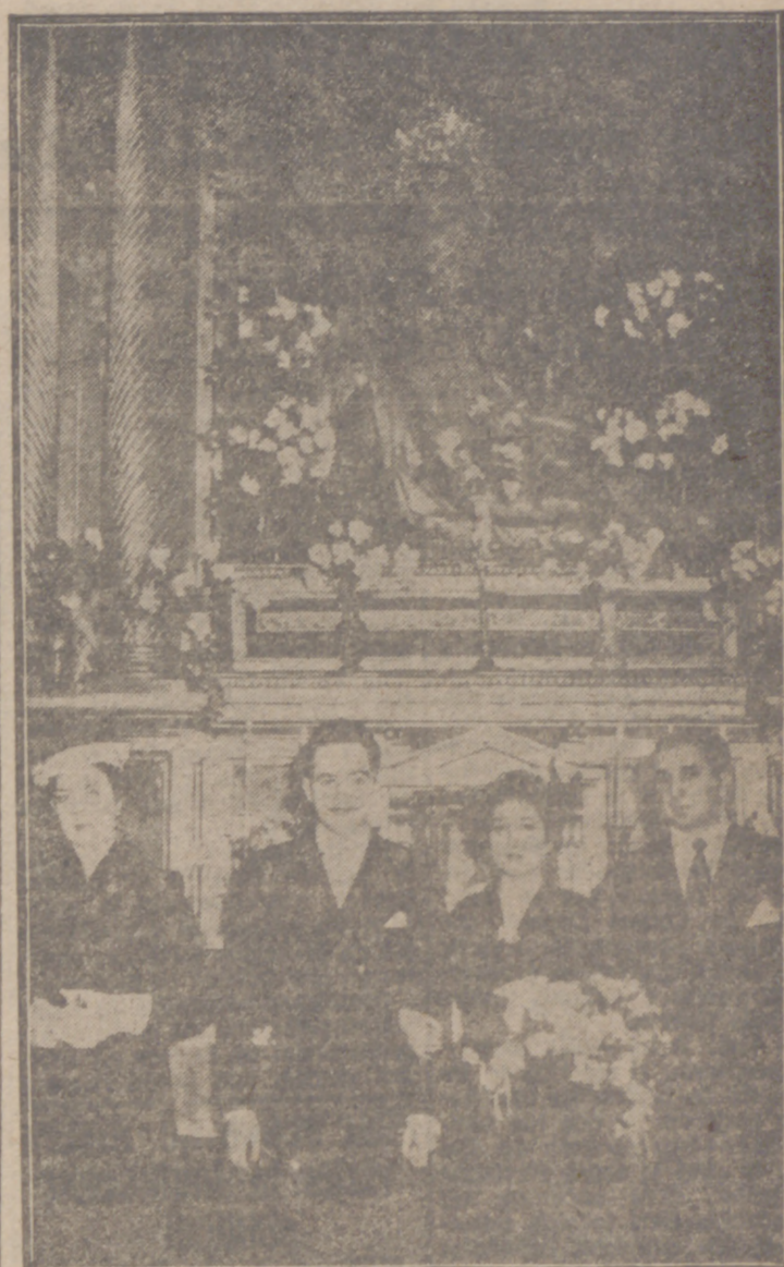
En la iglesia parroquial de San Martín, en la capilla de la venerada imagen de la Piedad, bellamente adornada con profusión de luces y flores, se celebró la unión sacramental del joven violinista de la Orquesta Nacional...