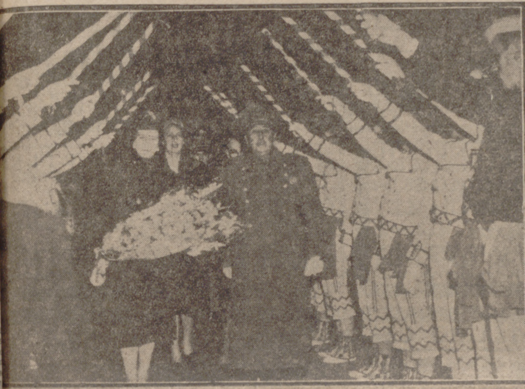
PAMPLONA.—S. E. el jefe del Estado, acompañado de su esposa, atraviesa una "calle" formada por un grupo de "daazaris" al dirigirse al altar donde el Vicario General de la diócesis les impuso la Medalla de San Fermín.

Tanto en la capital como en los pueblos que visitó, fué clamorosamente acogido por el vecindario. Solamente con constancia, tenacidad y sacrificios es como alcanzaremos la grandeza por la que murieron nuestros mejores"