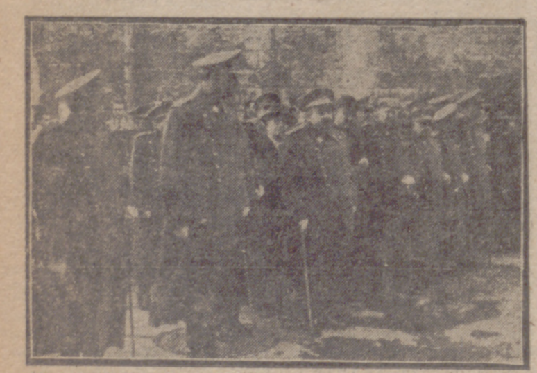
El capitán general y autoridades presenciando el desfile de las fuerzas de Artillería a la salida del acto religioso celebrado en la Iglesia del Salvador, con motivo de la festividad de Santa Bárbara

EL CUERPO DE ARTILLERIA CELEBRO AYER LA FESTIVIDAD DE SANTA BARBARA El Capitán General presidió el acto religioso