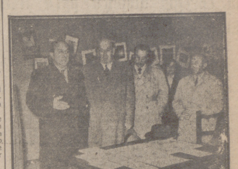
El alcalde, con el delegado de Información y Turismo, en el acto de la inauguración.