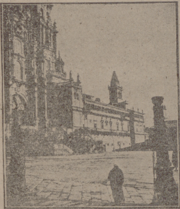
Una vista de la Catedral de Santiago

Nuestra entrega total a la empresa de dar cumplimiento a los postulados de la Revolución Nacional-Sindicalista; nuestro afán de abarcar todas las facetas de la vida española y hacer sentir en cada una de ellas el poderoso impulso renovador que entraña la Falange; el ardiente deseo de cubrir con la mayor rapidez las etapas que nos separan del objetivo final, nos imponen muchas veces dejar, como en una especie de segundo plano aquello que más ha de importarnos, puesto que es la sustancia, el impulso y la garantía de la obra-historia, en que estamos empeñados.