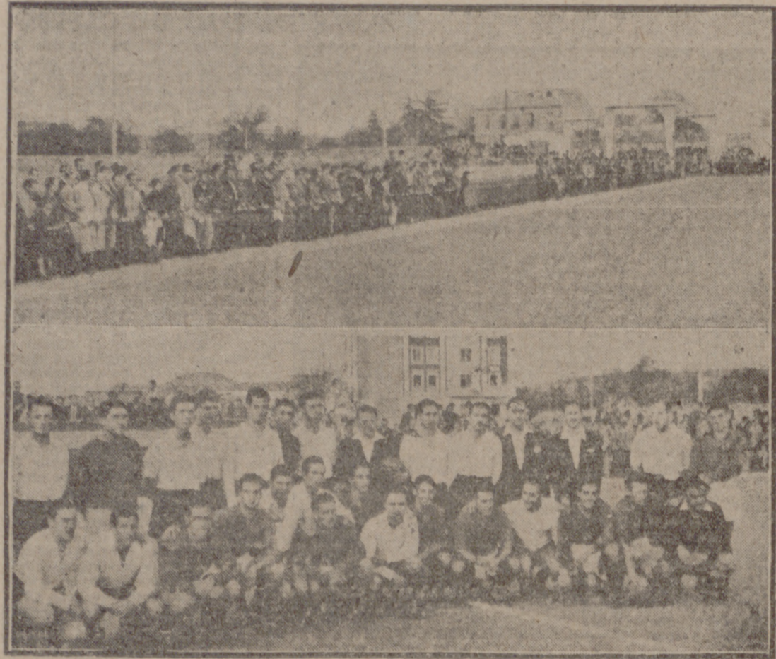
Arriba: Aspecto parcial del campo inaugurado y del público que en número crecido presenció el partido disputado.—Abajo: Jugadores que tomaron parte en el encuentro.