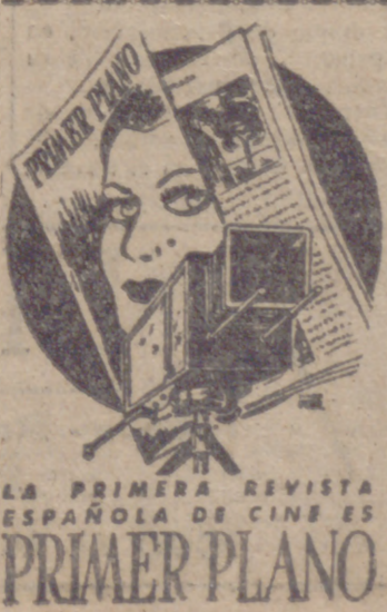
LA PRIMERA REVISTA ESPAÑOLA DE CINES PRIMER PLANO

El padre —o la madre— que sepa valorar esas deducciones, en el sentido de un avance gradual hacia conceptos de mayor