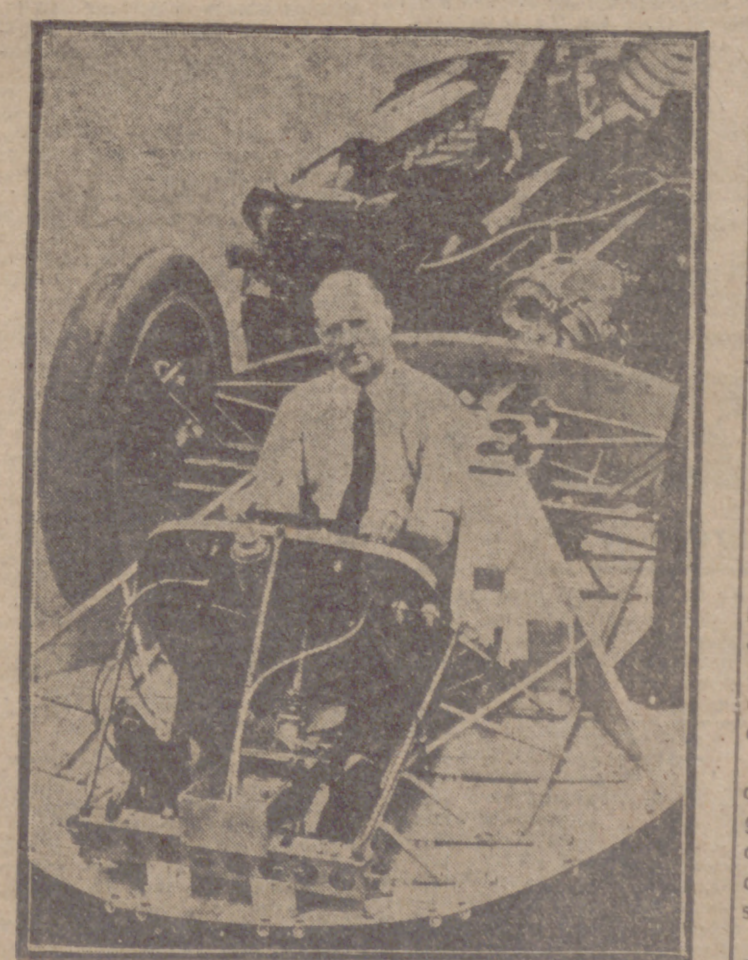
BRUMNROCHT.—John Cobb, famoso en el mundo por sus éxitos en lanchas a motor, que ha muerto a consecuencia de las heridas sufridas al destrozarse su lancha "Grusader", de reacción, durante un intento de superación del récord de velocidad en el agua.