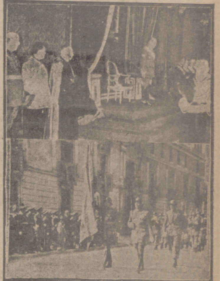
Dos momentos del acto celebrado ayer en Valladolid para exaltar el Día del Caudillo. El Excmo. señor capitán general presidente, con las primeras autoridades, la recepción celebrada en Capitanía, a la que siguió el desfile de la compañía del Regimiento de San Quintín, que rindió honores.

colocaron en los balcones de la Capitanía desde donde presenciaron el desfile de una Compañía del Regimiento de San Quintín, que rindió los honores de ordenanza. En la escalinata para subir a la sala de recepciones, una sección del Regimiento de Lanceros de Farnesio dió guardia en ésta y pasillos del edificio. La Banda del Regimiento de San Quintín interpretó el Himno Nacional a continuación del desfile mencionado, con lo que se dió por terminado este brillante acto celebrado ayer en honor al Caudillo de España y Generalísimo de los Ejércitos españoles.