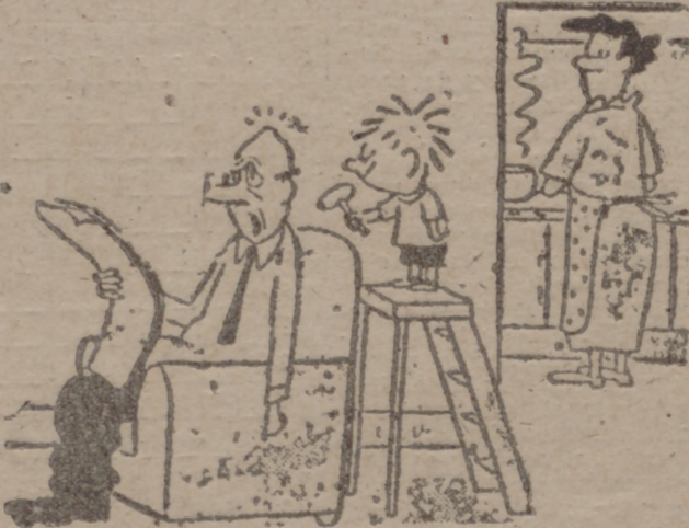
—¡Jaimito, deja de cazar moscas con el martillo!

Un explorador trata de inducir a un esclavo negro a que se vaya con él a Europa elogiándole las ventajas de la civilización, y le dice: —Aquí eres un esclavo. Ven a Europa y allí serás un criado.