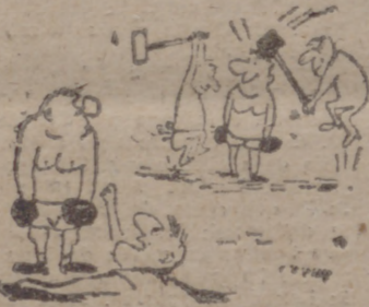
—No mires, están tratando de desmoralizarte.

Un explorador trata de inducir a un esclavo negro a que se vaya con él a Europa elogiándole las ventajas de la civilización, y le dice: —Aquí eres un esclavo. Ven a Europa y allí serás un criado.