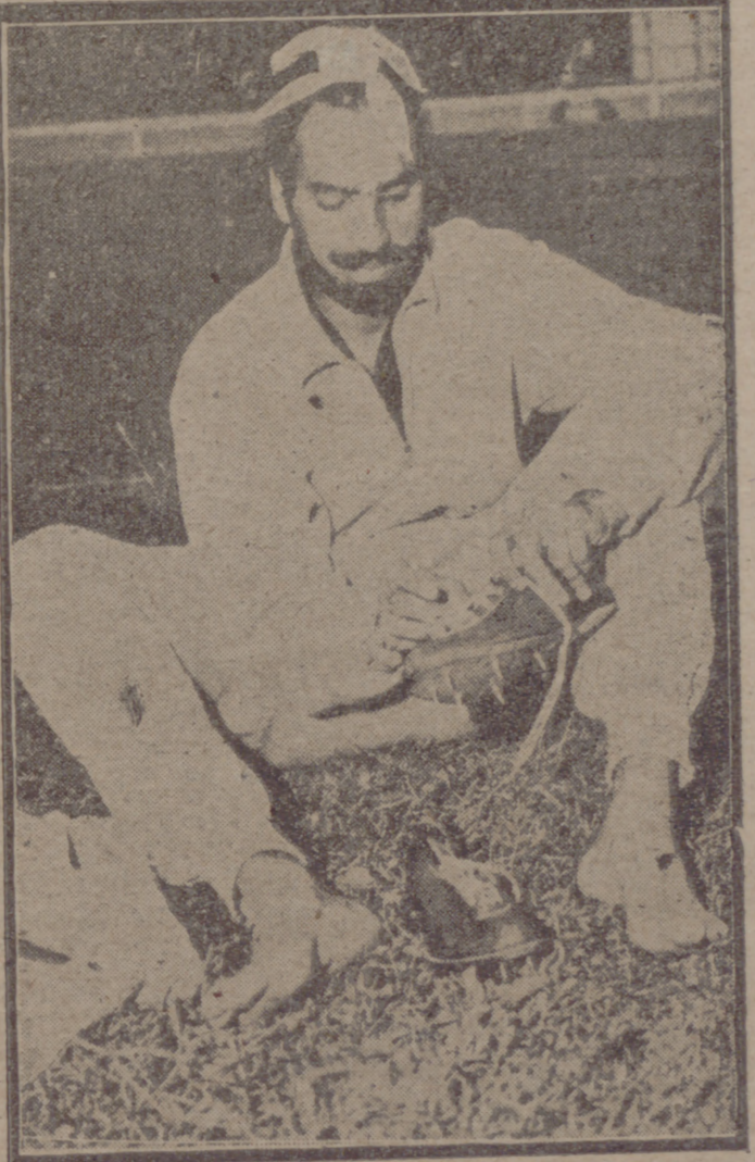
HELSINKI.—El atleta indio Mchaga Singh, con su extraño atavío en la cabeza que tanto llamó la atención a los espectadores y que recibió una de las más fuertes ovaciones de los Juegos Olímpicos por su actuación en las carreras de atletismo en que intervino.