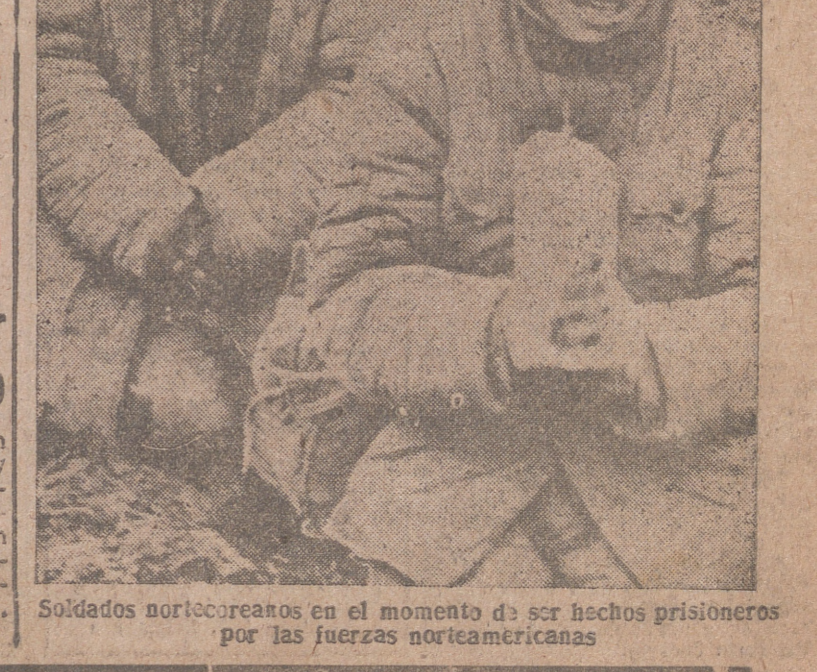
Soldados nortecoreanos en el momento de ser hechos prisioneros por las fuerzas norteamericanas