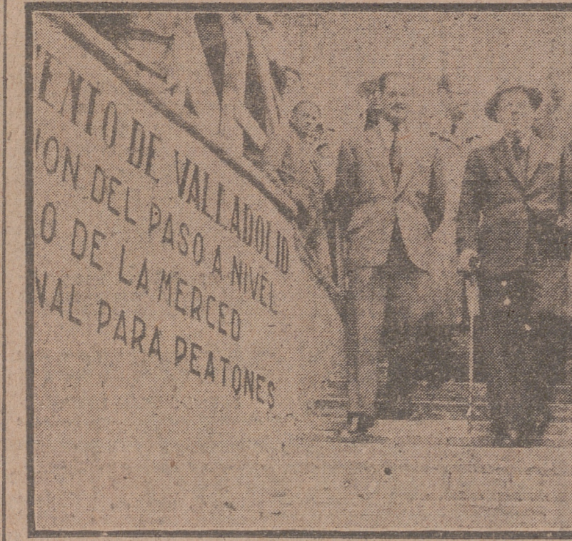
Momento en que el alcalde de la ciudad verificó ayer la apertura de paso de peatones subterráneo del Portillo de la Merced