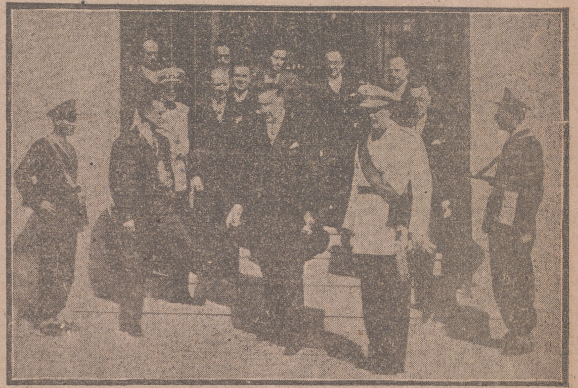
DAMASCO.—El ministro de Asuntos Exteriores, señor Martín Artajo, acompañado de los miembros de la Misión española, a la salida del hotel donde se hospedan para cumplir con el presidente de la República, general Fauzi Al Selo.