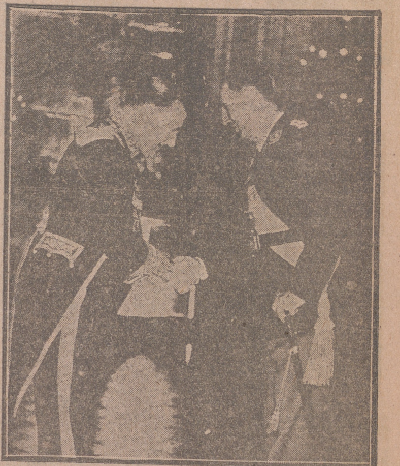
BUENOS AIRES.—El nuevo embajador español, don Manuel Aznar saluda al presidente Perón después de presentarle sus cartas credenciales en el Salón Blanco de la Casa del Gobierno.