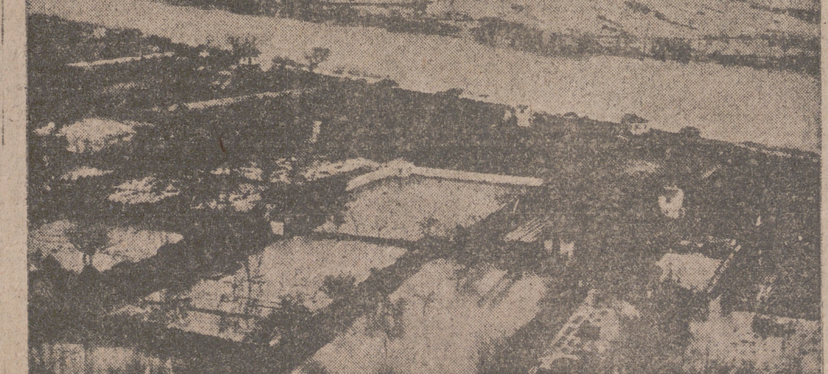
TUDELA. — Una vista de la huerita de esta ciudad llamada la "Mejana", completamente inundada al romperse los diques de contención del río Ebro, cuyas aguas alcanzaron un nivel de 6,26 metros sobre su nivel normal.