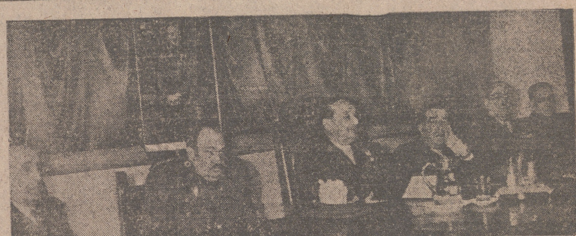
El excelentísimo señor Capitán General, acompañado de otros altos jefes, preside la inauguración del ciclo de conferencias militares. (Información, en última página.)