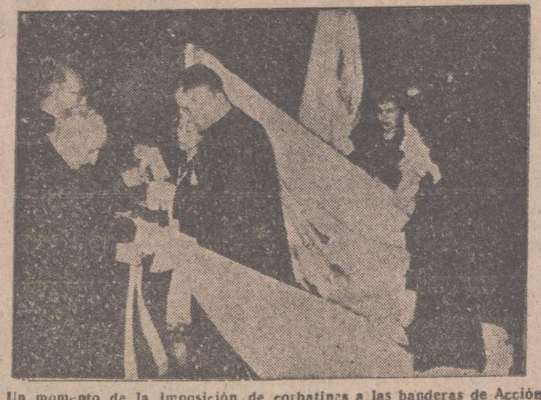
Un momento de la imposición de corbatines a las banderas de Acción Católica, celebrado en la Universidad.