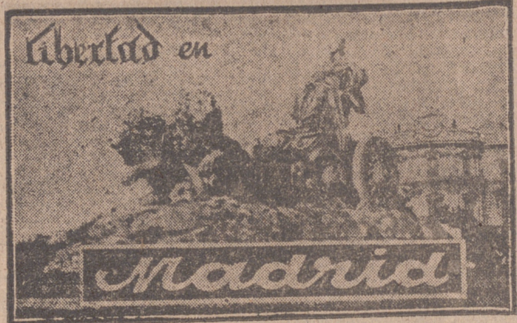
UNA CATEDRA SOBRE MADRID

Fué menos bullanguera que otros años CONGRESO INTERNACIONAL DE ABOGADOS EN MADRID