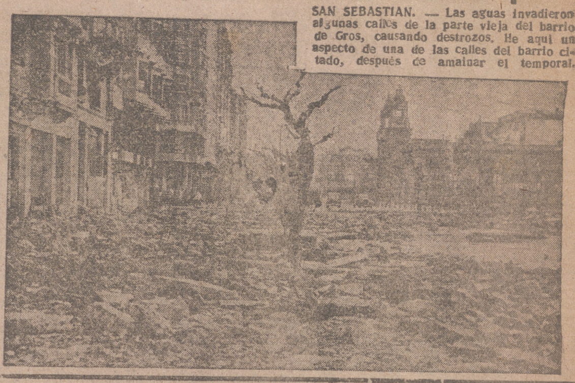
SAN SEBASTIAN. — Las aguas invadieron algunas calles de la parte vieja del barrio de Gros, causando destrozos. He aquí un aspecto de una de las calles del barrio citado, después de amainar el temporal.