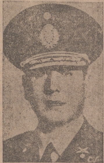
Inmediatamente fueron suspendidos todos los vuelos de aviones, tanto de salida como de entrada en el país. El general Perón se encontraba en el palacio presidencial, cuya guardia había sido reforzada, mientras una multitud de tres mil personas se congregaba ante la Casa Rosada. Aviones militares arrojaron sobre esta multitud, en la Plaza de Mayo, octavillas en las que se anunciaba el levantamiento del Ejército, la Marina y la Aviación argentinas.

Toledo, 28.—En las ruinas del Alcázar se ha celebrado esta mañana una misa de comunión, a la que asistieron los defensores de sus familias. Posteriormente fue oficiada, en el patio de Car-V, otra misa, a esta asistieron el Cardenal Primado, doctor Plá Daniel; el conde del Alcázar de Toledo, teniente general Moscardó; el general Martí y otros; autoridades provinciales, Dirección y Ayuntamiento, "bajas" y sesenta alumnos del colegio escolar "Luis Moscardó", Madrid, acompañados de sus esposas, que depositaron una corona de laurel ante el monumento erigido al hijo del conde del Alcázar de Toledo, Luis Moscardó, asesinado por los rojos. Estuvo también una representante de la Archicofradía de la Misma de San Francisco el