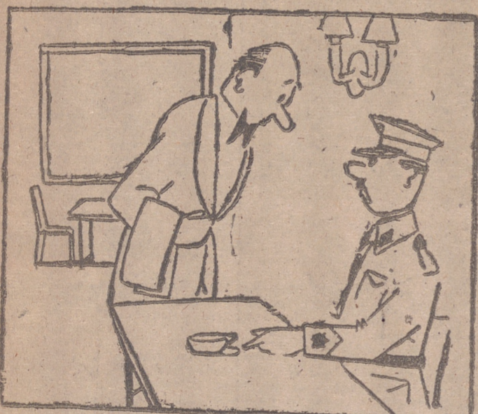
—Camarero, ¿ha servido usted aquí? —No, señor, en Tiradores de Iñfi.