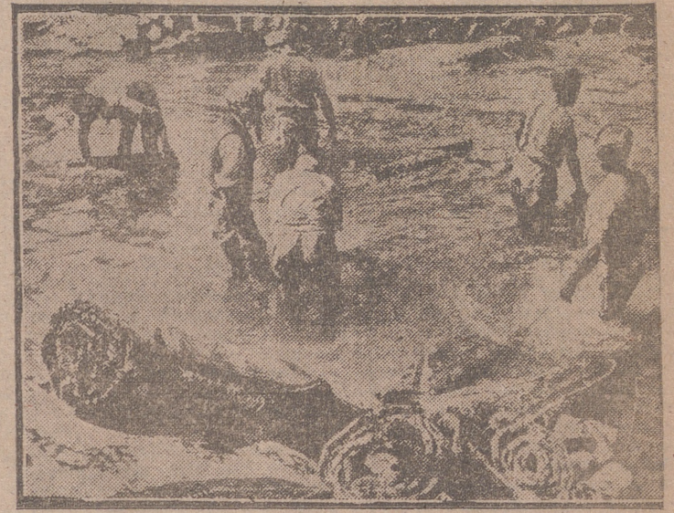
Una de las principales industrias persas es la de las alfombras, mágico vehículo en muchos cuentos orientales. Antes de la exportación son sometidas a un meticuloso lavado.

Entre sus dirigentes figura el príncipe FIROUX