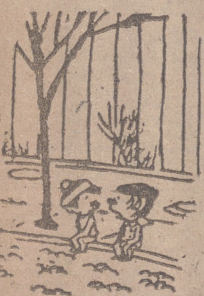
—¿Hay que ver qué de prisa pasa el tiempo! Decir que dentro de cincuenta años tendré sesenta...