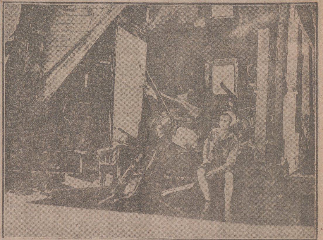
Grandes extensiones de terreno han sido inundadas por las aguas del Missuri, que han afectado especialmente a Kansas City. Ante la gravedad de los daños ocasionados, el presidente Truman ha visitado en avión las zonas siniestradas. Véase una casa destruida por la fuerza de las aguas. Un muchacho vigila los enseres salvados en espera de los dueños, que se vieron obligados a huir.