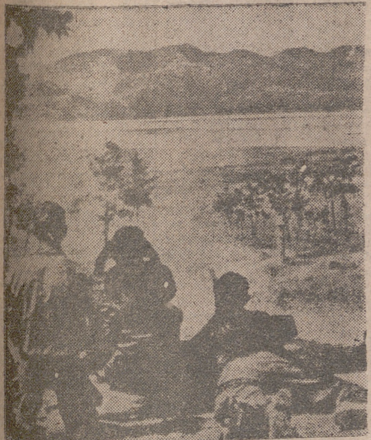
Mientras Stalin conserva intactas sus divisiones, Norteamérica se ve obligada a gastarlas en la sangría de Corea

Por mucho que sea el disimulo y el sigillo empleado por el dictador rojo de todas las Rusias y países satélites para encubrir sus siniestros planes de agitación y propaganda primero y de "activismo" después, y al fin de agresión y de dominio universales, lo cierto es que hay numerosos indicios que lo delatan y descubren. A su permanente política de absorción, de penetración y de relajamiento económico de las