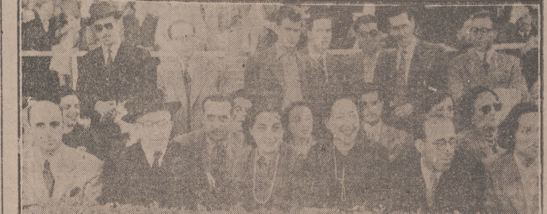
Como en días anteriores, las pruebas hípicas han reunido un público numeroso y selecto, que siguió con interés el desarrollo de las diversas competiciones.