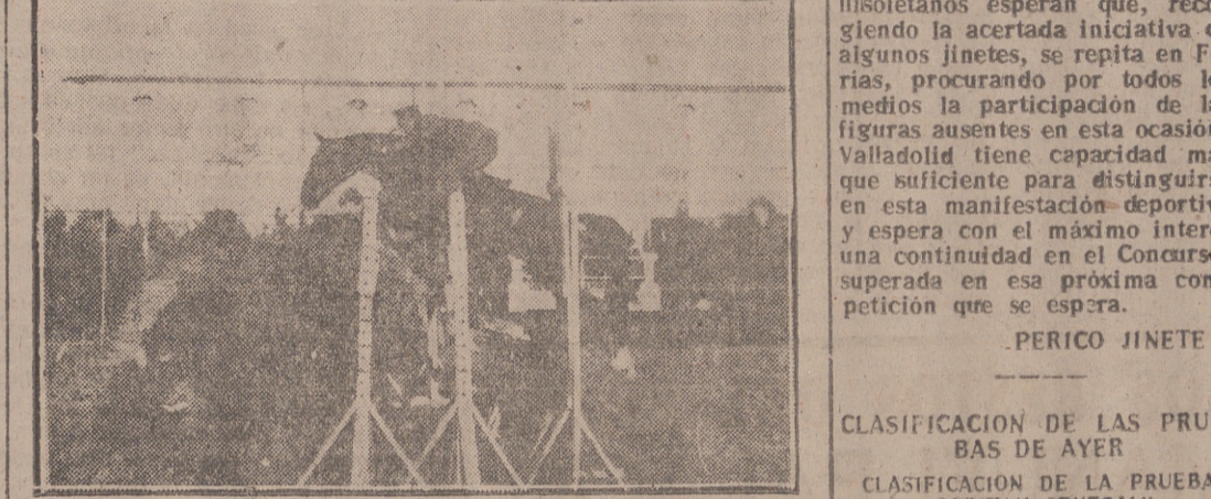
El Capitán Mayor Iglesias sobre "Incierto"

Ayer terminó el Concurso Hípico Nacional de Valladolid, que si no congresó a los mejores caballos españoles y a los jinetes más destacados, ha tenido interés y animación. La afición vallisoletana se ha congregado diariamente en las magníficas pistas de la Real Sociedad y de día en día ha aumentado el número en la jornada de ayer, que fue de simpatizantes, hasta culminar la más espléndida y concurrida del Concurso.