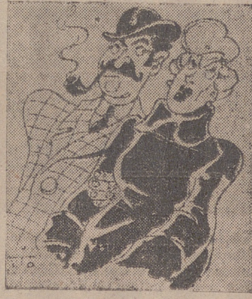
diodia, en cuantos lugares podían suponer posibilidad de echar una ojeada sobre la tan llevada y traída criminal.