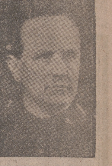
(Pasa a la 4.ª página.)

Francfort, 30. — El partido del canciller Adenauer, el demócrata cristiano, ha conseguido una victoria en las elecciones del Palatinado (zona francesa). Los comunistas, que tenían ocho puestos en el Parlamento de Rhin-Palato, han sido totalmente eliminados. Los cristiano-demócratas han ganado 43 puestos, los socialistas 35 y los demócratas libres 19. —Efe.