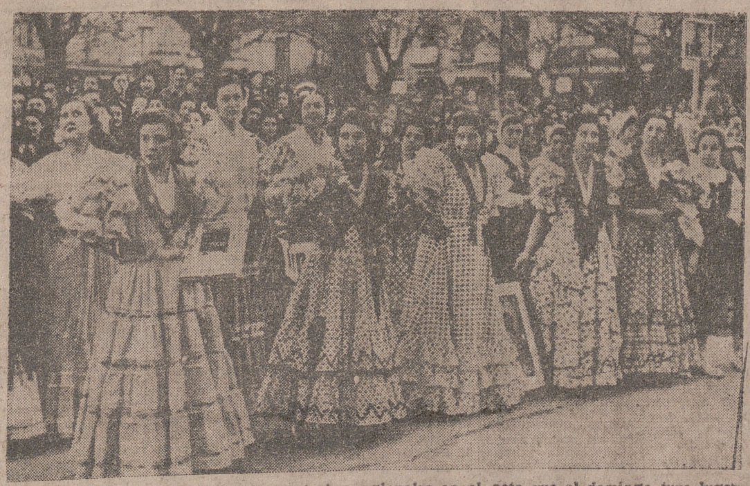
Un grupo de muchachas aaviadas con trajes regionales en el acto que el domingo tuvo lugar en la Plaza Mayor, como clausura del Congreso Nacional Mariano, celebrado estos días en nuestra ciudad