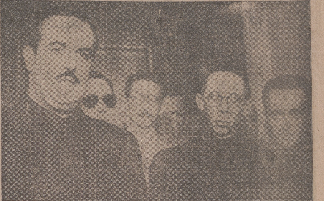
El Excmo. señor ministro de Trabajo, camarada José Antonio Giron, con nuestro jefe provincial y gobernador civil, camarada Alonso-Villalobos, en la Jefatura Provincial del Movimiento, donde recibió y habló a la Vieja Guardia el pasado domingo.

El Parlamento iraníano ha votado la nacionalización de las empresas petrolíferas. Antes, grupos nacionalistas se manifestaron contra Inglaterra, que tiene en aquellas las principa-