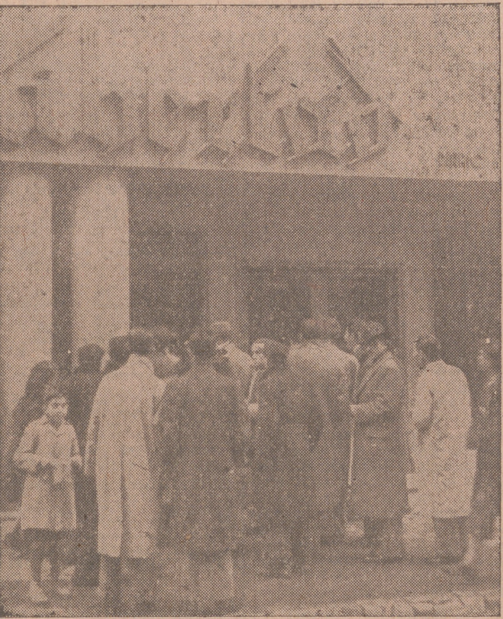
Durante toda la mañana de ayer se formaron, frente a la entrada de nuestro periódico, unos grupos, que seguían atentamente las incidencias del sorteo.