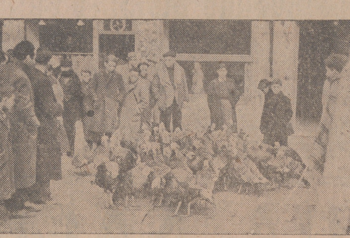
Un puesto de las clásicas aves de Navidad en el Mercado del Campillo.