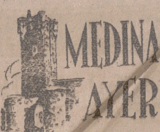
Medina del Campo

Decididamente hemos entrado en el otoño como nos lo atestiguan las lluvias con que fué recibida el sábado, este sábado inolvidable de Medina en vísperas de mercado. Hemos notado una fluidez enorme en las bocas de riego, lo que nos hace presumir que se está produciendo algún fenómeno en la teoría de los vasos comunicantes. Una de la Plaza de España llegó a hacer charco. Se cantó la Salve a la Virgen del Carmen. Continuaron los novenarios a San Miguel y a Nuestra Señora del Rosario. Hubo cine en el Coliseo, y las puertas de Versalles continuaron abiertas, sin que podamos asegurarnos si aún se sigue bailando. Hemos recogido nuevas noticias sobre las reparaciones de la Colegiata, y parece ser que se está arreglando la última bóveda de la torre. Se dió a stri buye el racionamiento. Pilar Primo de Rivera salió para Madrid. Las cursillistas de la Sección Femenina abandonaron la Escuela camino de sus correspondientes destinos. Cuando lean ustedes esta croquisilla, los relojes habrán robado una hora al tiempo.