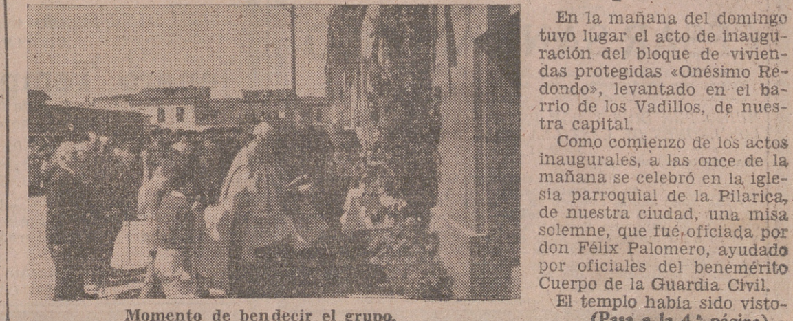
Momento de bendecir el grupo.

El templo había sido visto. —(Pasa a la 4.ª página)