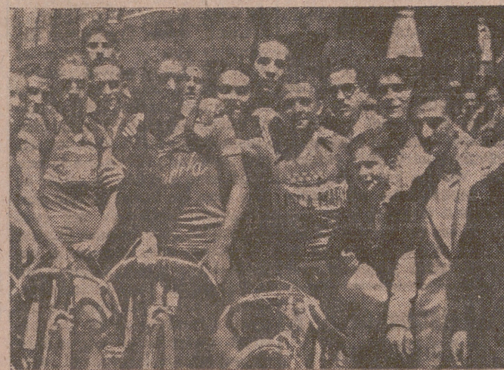
Los tres primeros clasificados a su llegada a la meta.

«Que en la ciudad del Pisuerga se pega a los pedales y que los vallisoletanos corren en bicicleta catalogándose como de clase en el ciclismo nacional, patentizado lo tenemos en la prueba del domingo.