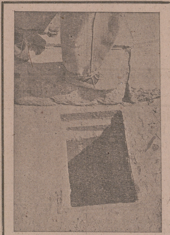
Artística fotografía... Podemos asegurar al curioso lector que no se trata de ningún nicho de muerto, ni descubrimiento alguno arqueológico, ni

tampoco el fin de gigantescas obras donde en empinada ardua vayan a guardarse documentos fehacientes de la actual civilización para pasmo admirativo de los venideros siglos. Nada de eso, lector.