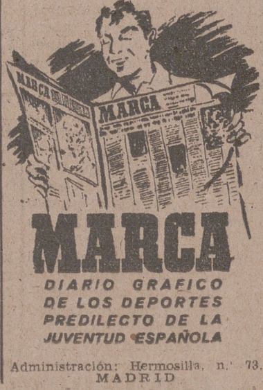
Administración: Hermosilla, n.º 73. MADRID