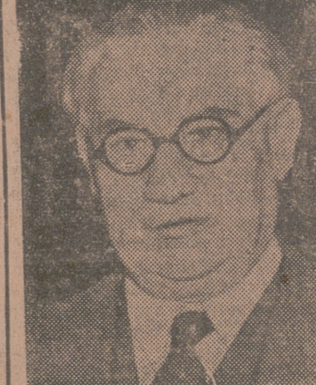
Londres, 31.—El secretario del Foreign Office, Bevin, ha celebrado una prolongada conferencia con el primer ministro, Atlee, acerca de la conferencia de Moscú.