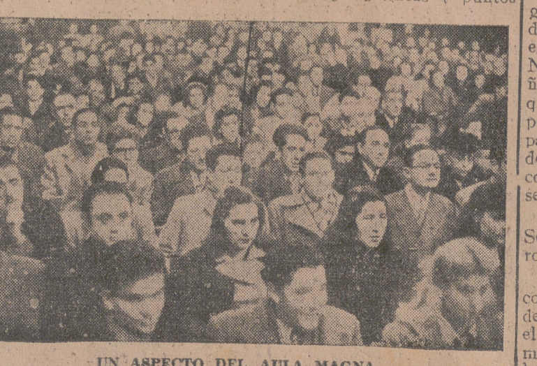
UN ASPECTO DEL AULA MAGNA.