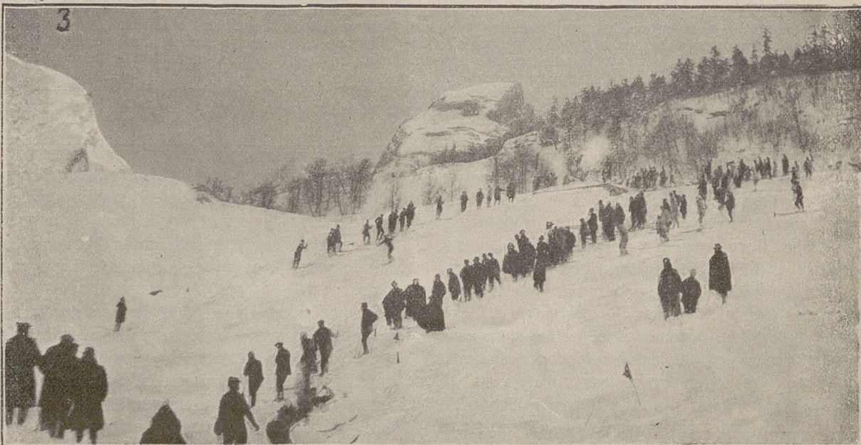
1. El refugio á las cabañas.—2. En la pradera.—3. La pista y los trampolines para los saltos.

El juego de Skis es uno de los favoritos para los franceses en los distintos deportes á que la nieve presta sus títulos para poderlos practicar. Nuestra fotografía sorprende á varios jugadores ejercitándose en el bonito deporte, en los alrededores de la población de Pau.