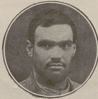
"El Chato de Cuqueta" autor de tres asesinatos (uno de ellos el del Juez de Cullera) condenado á tres penas de muerte por dos Consejos de guerra é indultado por la iniciativa de D. Alfonso