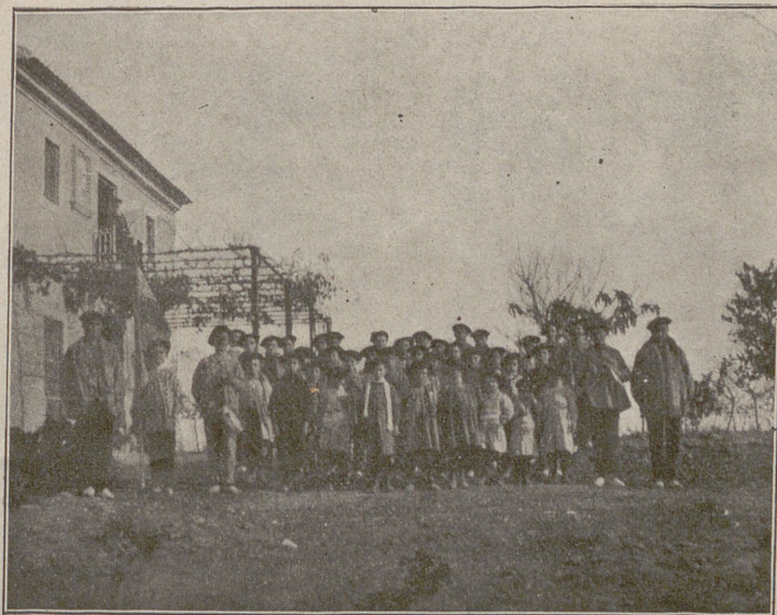
El Requeté de Vinalesa