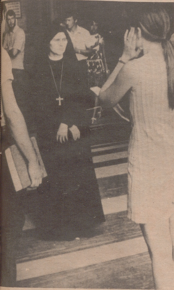
CIUDAD DEL VATICANO.— Una monja en la entrada de la basilica de San Pedro no permite la entrada a una joven en mini-falda. Ha sido una medida del Vaticano para la campaña contra la inmodestia.