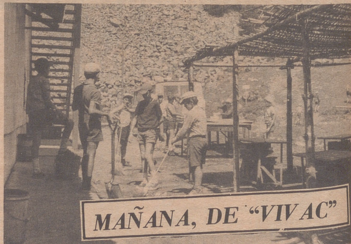
MAÑANA, DE "VIVAC"

C AMPAMENTO "VIRGEN BLANCA", 28 ("ARAGON/exprés").— Predomina el buen tiempo por estas latitudes. Tanto que el baño diario es uno de los momentos principales de la jornada. El sol y el aire de la montaña han dado a la piel de los muchachos, en los días que llevan por aquí, un color que hubiera precisado de un mes e la playa. Los primeros días hubo cierta inestabilidad atmosférica, como ya