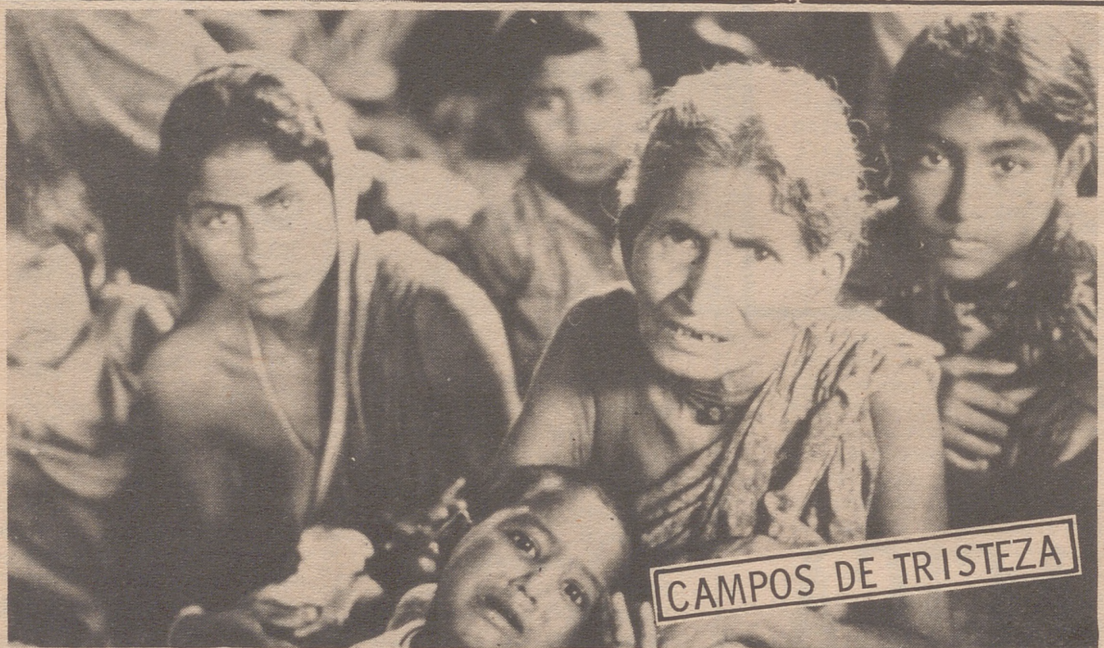
AGARTALA, India.— Estos refugiados son parte de los 5 millones y medio de personas que han abandonado sus casas en Bengala del Este para buscar seguridad en la India. Este grupo ha sido fotografiado en el campamento Durga Bari, cerca de Agartala.

El parlamento también debe elegir la presidencia del Estado, un nuevo cuerpo de administración federal de 22 miembros, propuesto por el presidente Tito durante el pasado septiembre. Este compuesto por tres miembros de cada una de las seis repúblicas yugoslavas, y dos de cada una de las dos regiones autónomas. Esta destinada a ser una especie de "presidente colectivo", que se espera dirija el país cuando Tito se aleje de la política. Su presidente era el presidente de Yugoslavia.