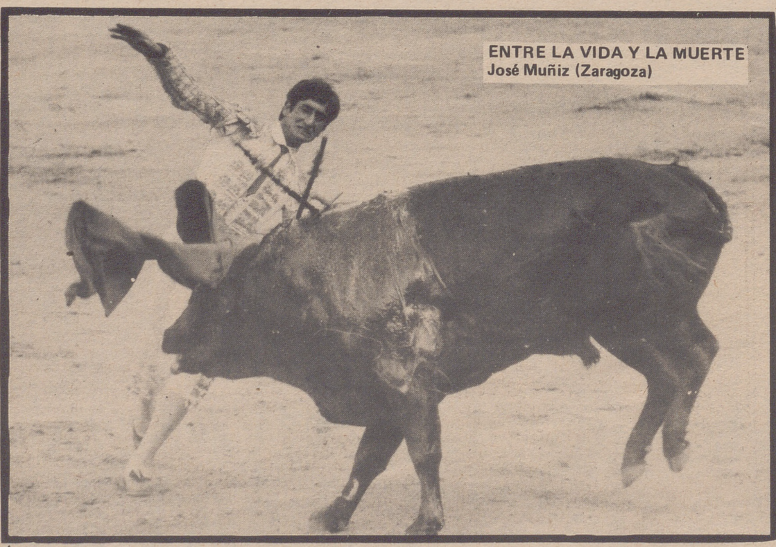
ENTRE LA VIDA Y LA MUERTE José Muñiz (Zaragoza)

Lo ideal sería -volvemos a insistir- convertir esta página concurso de fotografías en una auténtica página de noticias gráficas. Entendemos que con el tiempo se lograra, aunque las dificultades hay que darlas por supuestas. Ahora mismo, con la muerte de un torero, la actualidad se centra en el tema taurino y este no puede estar ausente en nuestra página de hoy. Fotos de nuestra tierra, de nuestras cosas. Estas son, por el momento, las preferidas. Un premio hay en el aire cada semana. Concursan doce fotografías. ¿Será esta semana la semana de su foto? Vamos a verlo.