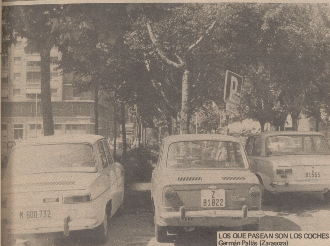
LOS QUE PASEAN SON LOS COCHES Germán Pallás (Zaragoza)