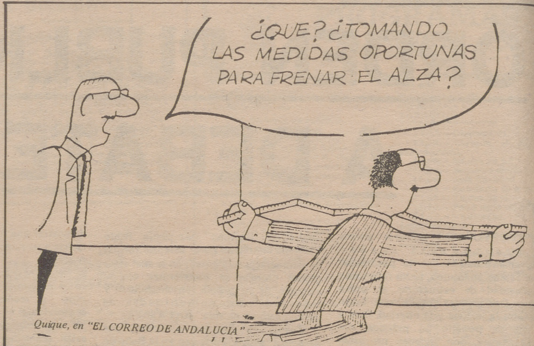
Quique, en "EL CORREO DE ANDALUCIA"