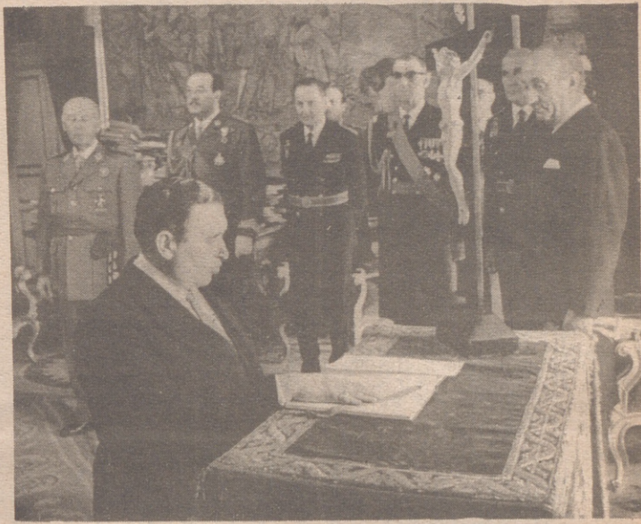
EL PARDO.— El nuevo Consejero del Reino, señor Araluce Villar, ha prestado juramento de su cargo ante el Jefe del Estado, en el palacio de El Pardo.