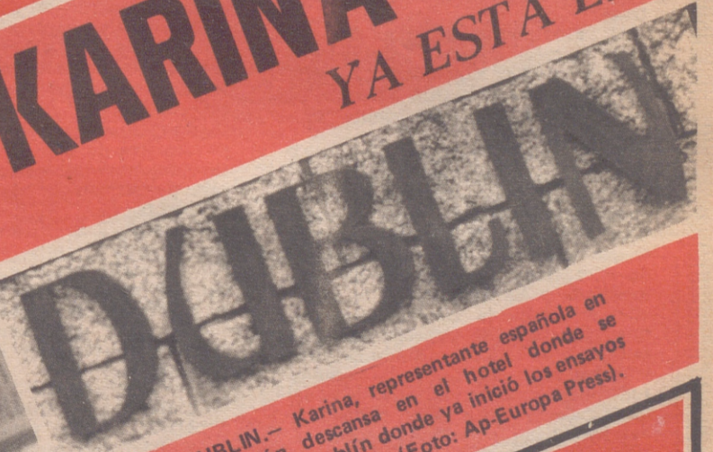
DUBLIN.— Karina, representante española en Eurovisión descansa en el hotel donde se hospeda en Dublín donde ya inició los ensayos para Eurovisión.