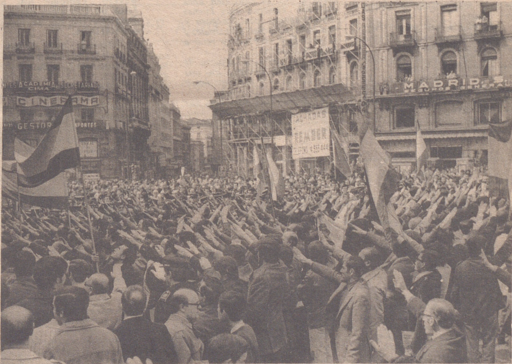
MADRID.— Después de un acto religioso celebrado en la Iglesia de San Ginés los asistentes se dirigieron hacia la Puerta del Sol, donde ante la dirección general de Seguridad entonaron el Cara al Sol. Información en página cinco.

MADRID, 2 (Crónica de Europa Press, por Antonio Santander, en colaboración para "ARAGON/express").— Por un cuadro del cordobés Romero de Torres, titulado "Adolescencia", se han vendido en la sala de arte y revistas "Duran" la notable cifra de 2.150.000 pesetas. Se trata de un óleo de lienzo de 55 por 40.