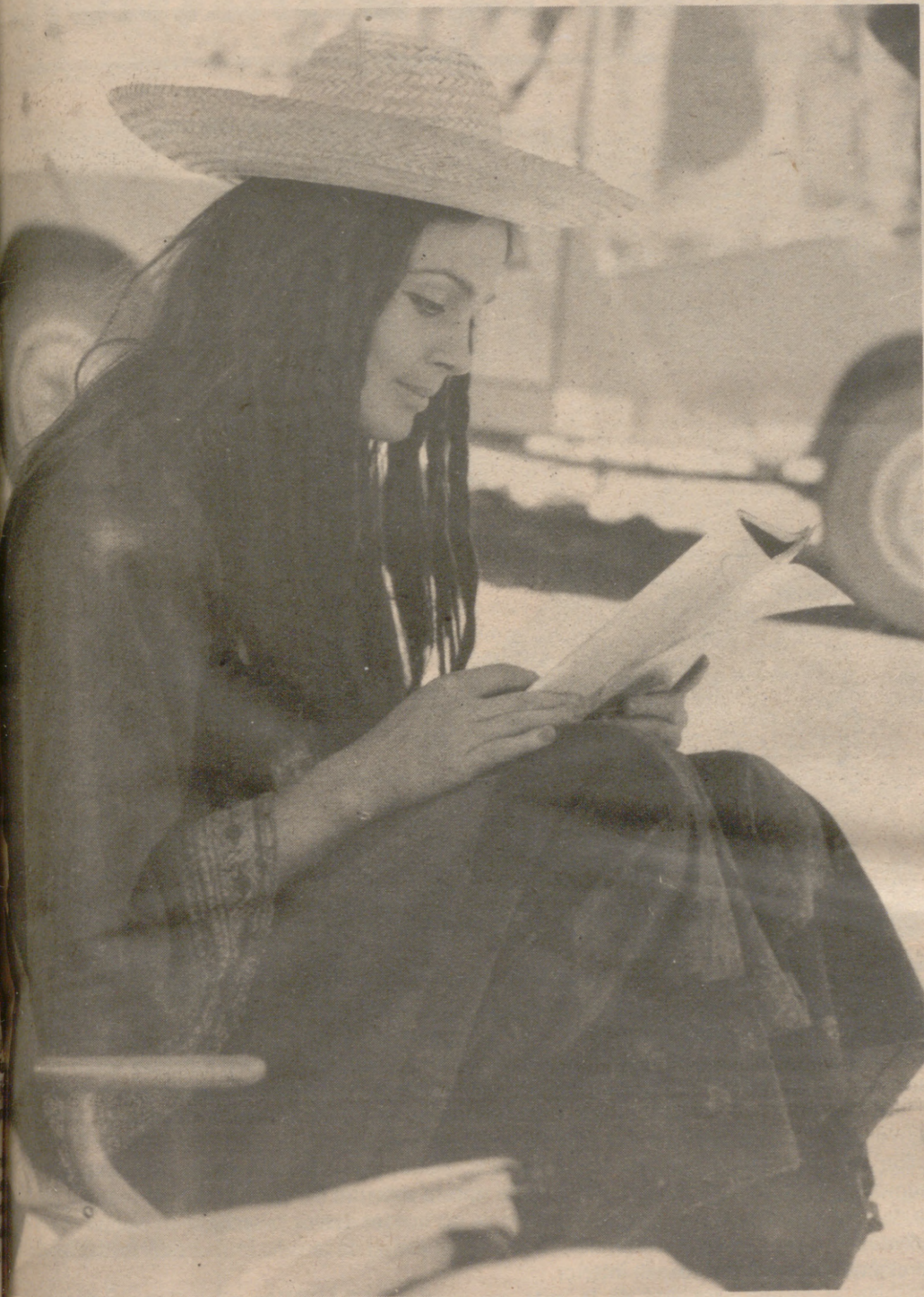
GUADIX.— Leigh Taylor Young, joven actriz del cine americano que junto a Omar Sharif y Jack Palance rueda en Guadix "los caballistas" bajo la dirección de Frankenheimer.