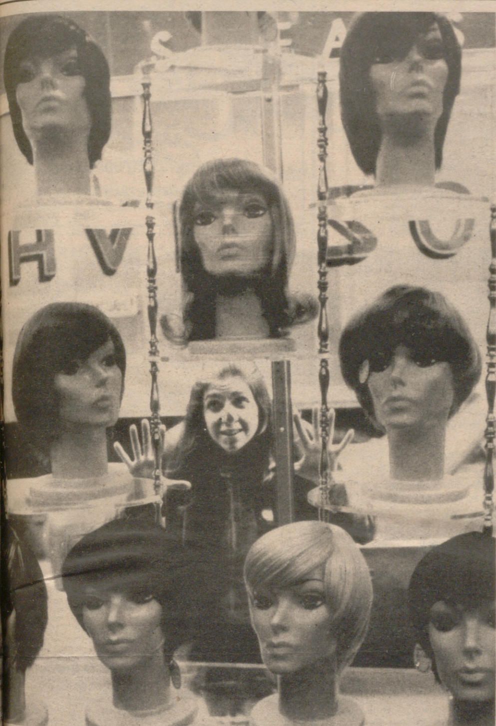
YORK.—El "National Bank of América" ("Banco Nacional de América") para atraer clientes, ha "ideado" un sistema. Haciendo un depósito de 25 dólares, cualquier dama tiene derecho a elegir una peluca de las que se exhiben en sus escaparates, pagando únicamente la suma de cinco dólares. Pero la oferta solo era válida para el pasado 14 de abril, fecha en que el Banco inauguró una nueva sucursal.