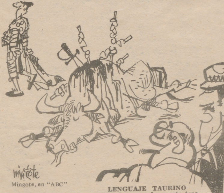
Mingote, en "ABC"