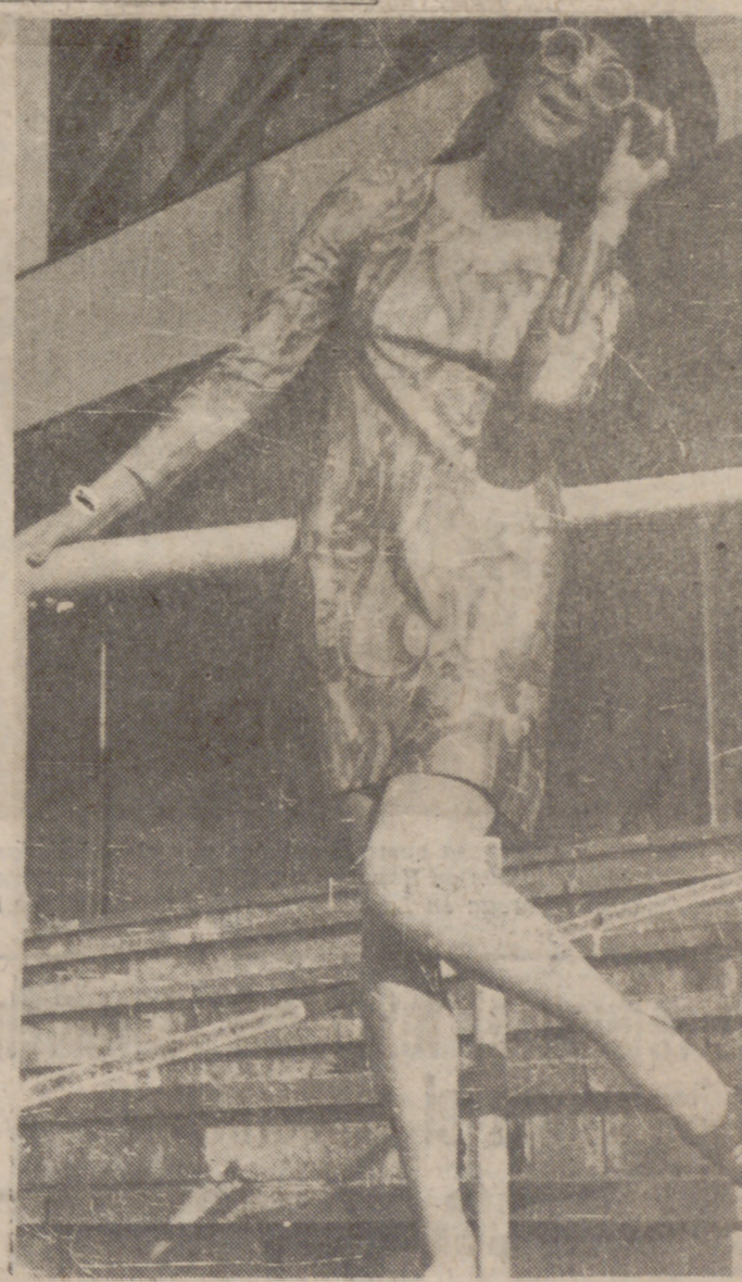
Una guapa modelo luce un vestido en jersey Arnel, estampado en verde, naranja y blanco, de líneas muy simples y de manga larga. Sobre esta moda del estampado y otras cuestiones, informamos ampliamente a nuestras lectoras en la página séptima.