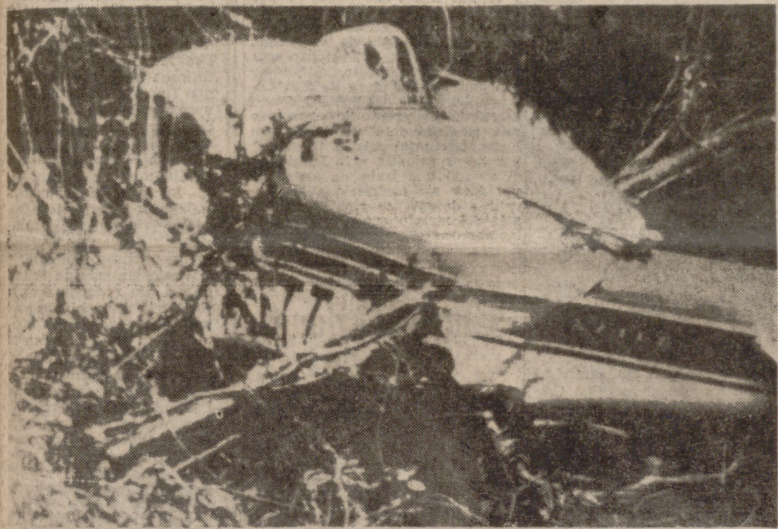
FORTALEZA (Brasil).—He aquí el avión en el que viajaba el expresidente brasileño Castello Branco, después del accidente sufrido al chocar contra un avión de las fuerzas aéreas del Brasil. Perecieron el citado mariscal Castello Branco y cuatro personas más.