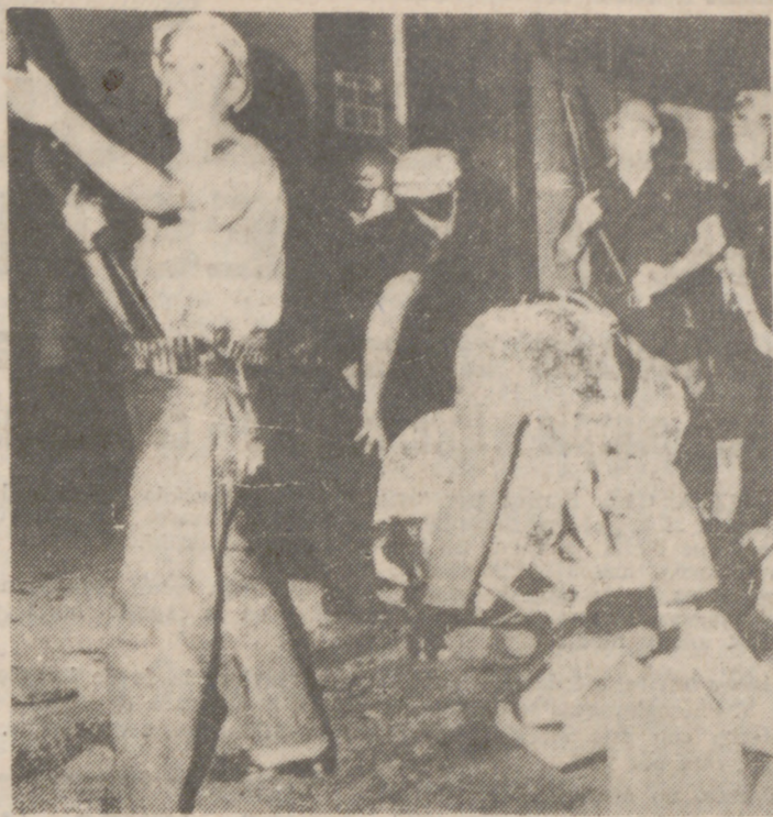
NEWARK (Nueva Jersey).—Policías permanecen vigilantes mientras sus compañeros atienden a otro que ha sido alcanzado por las balas durante los disturbios raciales habidos en esta ciudad.