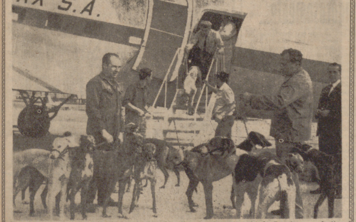
MADRID.—Casi medio centenar de galgos han llegado al aeropuerto de Barajas con destino a las competiciones galgüeras españolas. Han sido importados de Irlanda por la Federación Galgüera Española. En la foto, un momento de la llegada de los animales a Barajas.