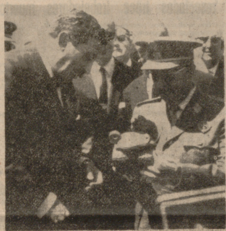
HUELVA.—El Caudillo ha inaugurado la refinería «La Rábida», en un acto celebrado ayer.