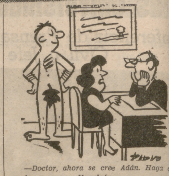
—Doctor, ahora se cree Adán. Haga que vuelva a creerse Napoleón.

HORIZONTALES. — 2: Esté. 3: Tributo, impuesto. 4: Contribución extraordinaria. 5: Cabaño de corta edad. Cierto reptil. 6: Ejemplar, tomo. Descendientes. 7: Nombre árabe. Sitio donde se prensa la aceituna. 8: Marchares. 9: Pasaje con vegetación. 10: Nave. VERTICALES. — 2: Nombre de mujer. 3: Moneda antigua. 4: Color aceitado claro. 5: Sedito que se adhiere al fondo y a las paredes