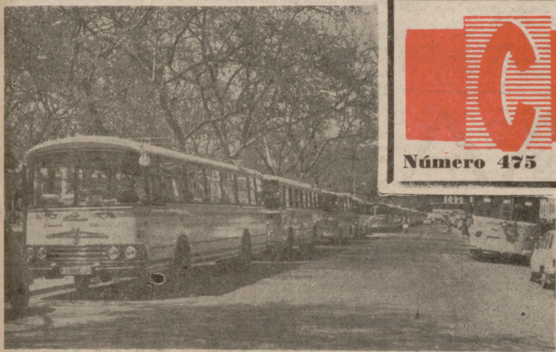
CERCA DE CUARENTA AUTOCARES.—Aunque el Rayo y el Valladolid no ventilaban un partido trascendente, se volcó la hinchada vallecana, que acudió en masa. ¿Para alentar a su equipo? ¿Para hacer excursión? ¡Vaya usted a saber! El caso es que la Avenida del Generalísimo ofrecía este aspecto, con cerca de cuarenta autocares aparcados.