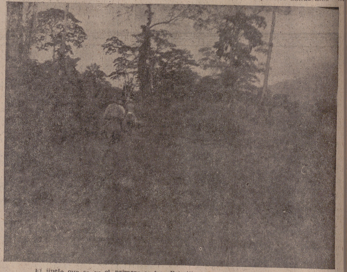
El jinete que se ve el primero es fray Primitivo, momentos antes de ser flechado.

para llevar el bien a tantos rincones de la Tierra, en los cuales aún no ha llegado la civilización. La Iglesia ha puesto cuanto ha estado de su parte en este cometido y va por delante de los pueblos dando magníficos