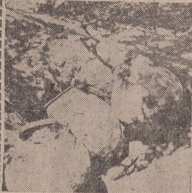
Vasijas para guardar los huesos de los difuntos.