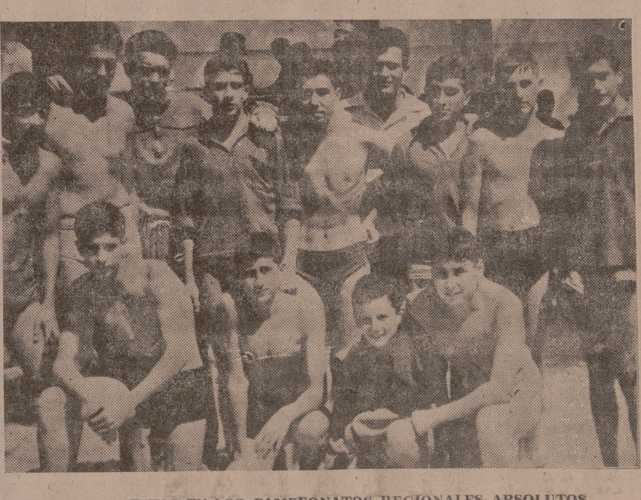
LOS EQUIPOS DE ASTURIAS Y VALLADOLID, QUE HAN OCUPADO LOS PRIMEROS PUESTOS EN LOS CAMPEONATOS REGIONALES ABSOLUTOS CELEBRADOS EN LAS PISCINAS