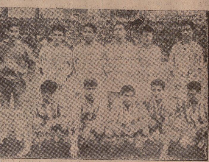
REAL VALLADOLID, JUVENIL