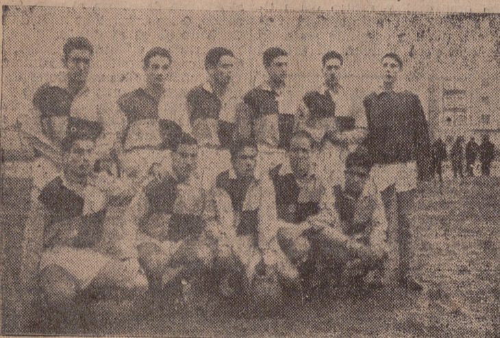
El Castilla palentino no pudo con el juego del Betis.