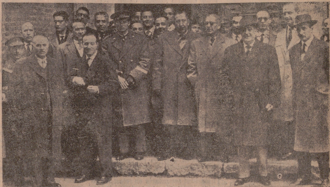
LOS ASISTENTES A LAS REUNIONES

Comenzaron ayer y serán clausuradas mañana por el Capitán General