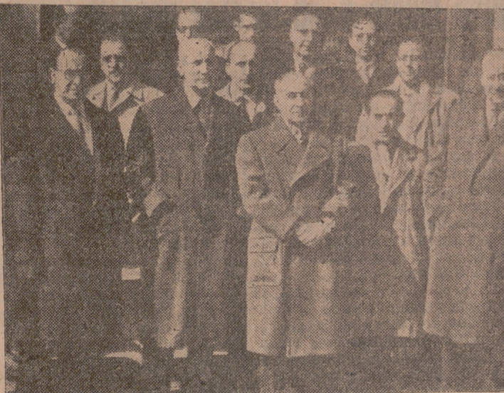
Los asistentes a los actos celebrados con motivo del LII aniversario del Instituto Nacional de Previsión.

Fueron entregados premios a maestros mutualistas y escolares distinguidos