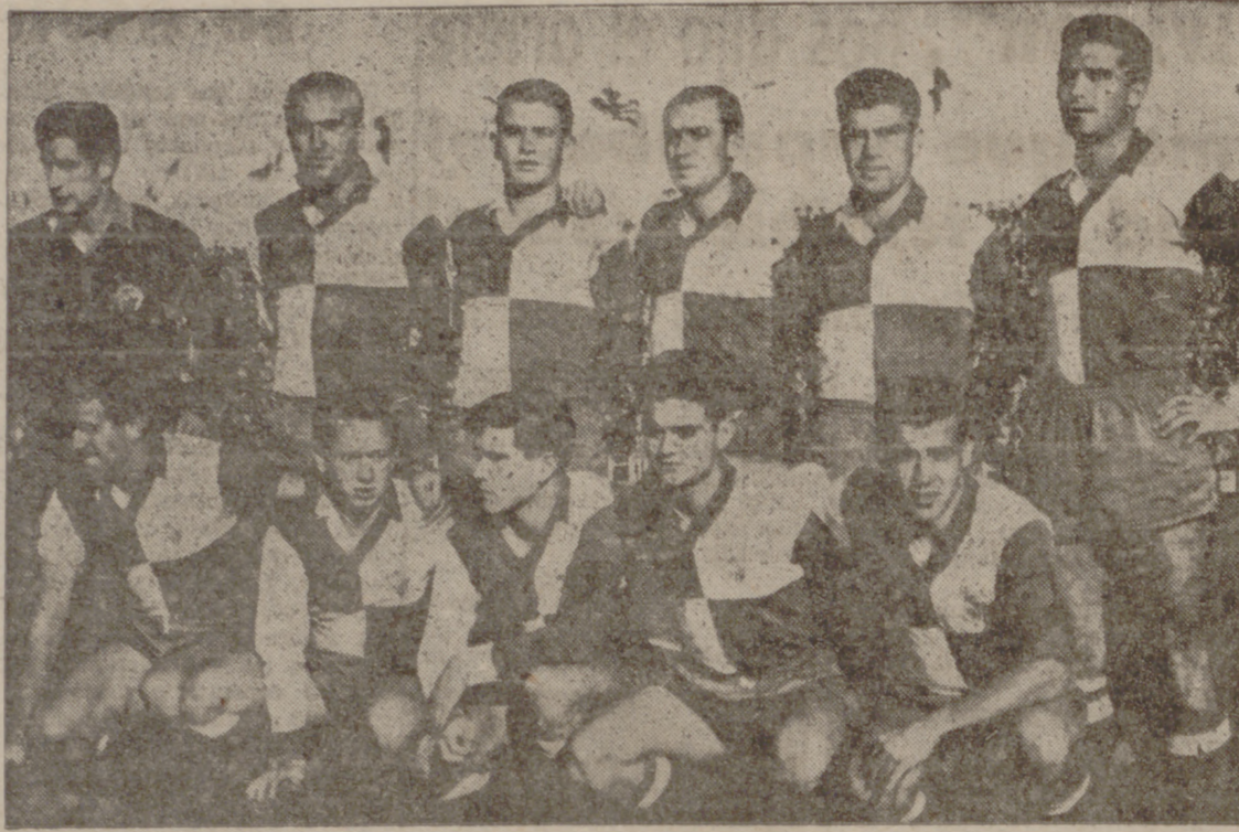
Este es el equipo sabadellense, a quien derrotó el Valladolid por 4-0.