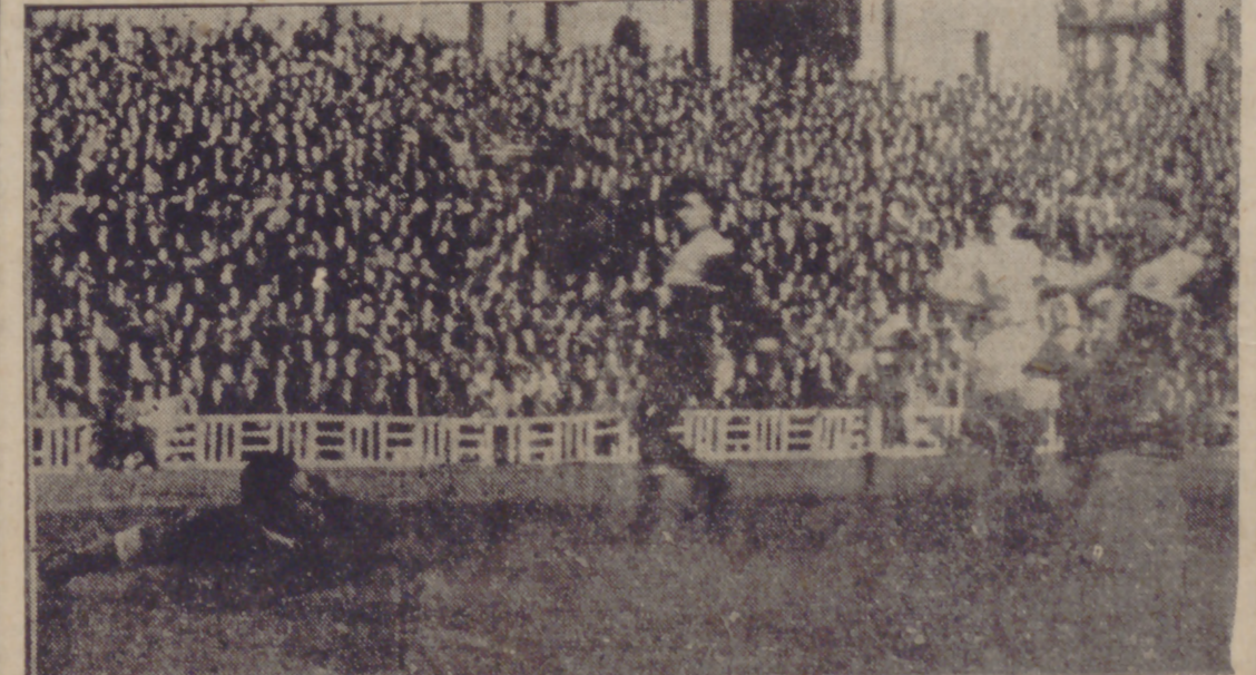
Aunque no figura en la foto, Beascochea marca el tercer gol de la tarde, después de una sorprendente intervención de medio equipo. Por fin logró su tanto, el primero de todo el campeonato