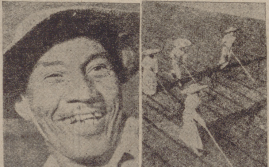
Das estampas características. Un tipo mestizo-blanco-indio junto al continuo laborar en las plantaciones de café.

Al cabo de un rato estaba con él. Era un tipo menudo, con el pelo crespo y el mirar un poco lánguido. Al lado de su escolta, de hombres fornidos, resultaba asouchimizado y poca cosa. Pero se veía que le temían. Había algo en sus ojos y en sus gestos que denotaba el jefe improvisado, pero capaz de