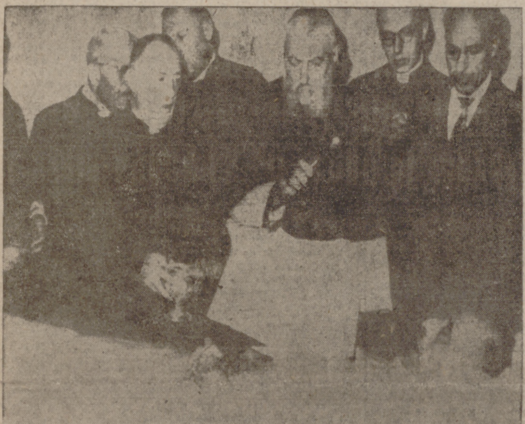
A los pocos momentos del fallecimiento de Su Santidad Pío XII, el decano del Sacro Colegio Cardenalicio, cardenal Tisserant, bendice al Santo Padre en su lecho mortuario.

Ciudad del Vaticano, 10.—Se tiene entendido que durante la Congregación General de Cardenales de hoy se tratará de decidir la fecha en que se ha de celebrar el Conclave cardenalicio para elegir al sucesor de Pío XII.