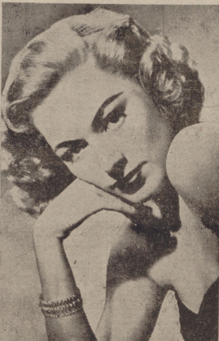
A la extensa lista de excelentes interpretaciones de la actriz Eleanor Parker se debe agregar ahora otra película Metro Goldwyn Mayer, «The Seventh Sin», en la que tiene por compañero al actor inglés Bill Travers.

CINEMA ROXY MAÑANA: ACONTECIMIENTO GIGANTE ¡Espectacular estreno! EL SECRETO DEL PIRATA en brillante TECHNICOLOR Por JOHN PAYNE y ARLENE DAHL ODIOS... ABORDAJES... VENGANZAS... UN ESPECTACULO SENSACIONAL ¡LA MAS FANTASTICA HISTORIA DE PIRATAS QUE HA REALIZADO EL CINE AMERICANO! (Tolerada menores)