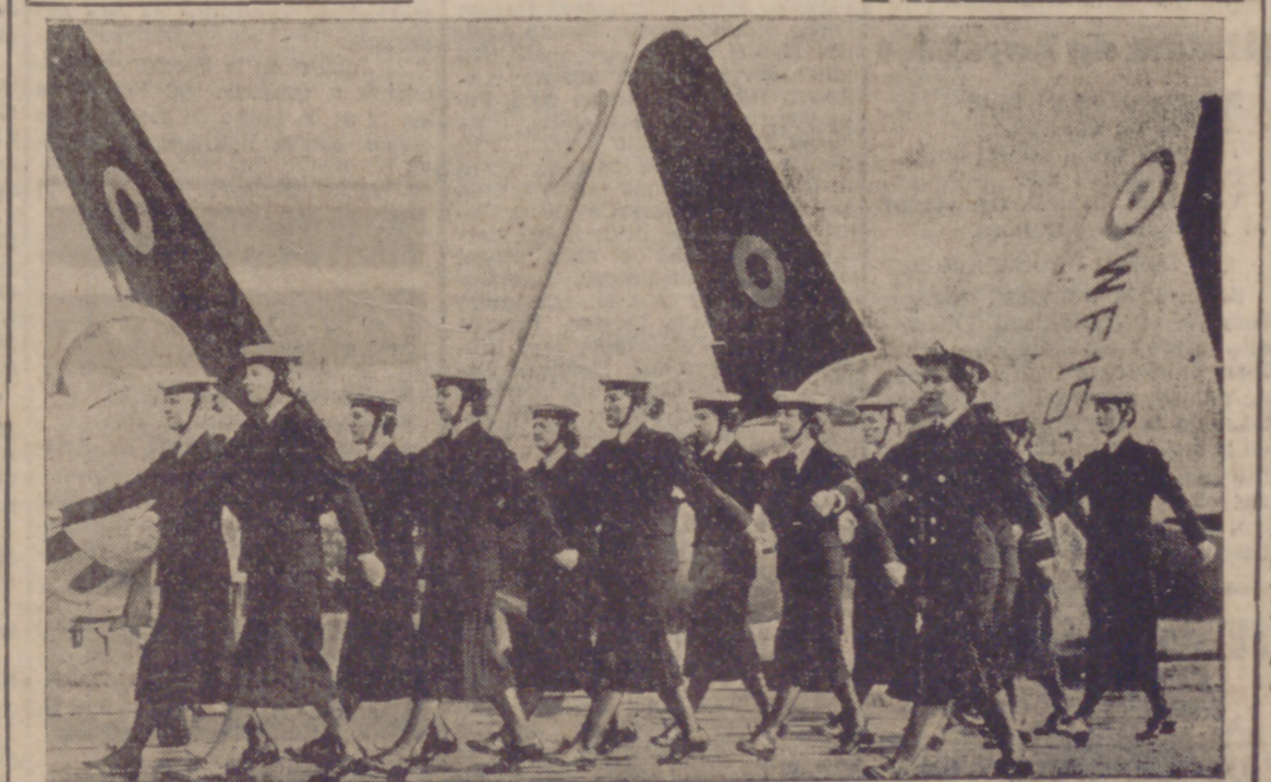
No es un desfile militar corriente el que presenciemos en la fotografía. Aunque las uniformadas chicas muestran su marcialidad, lo hacen ante la cámara cinematográfica. Como la trama del mismo está fundamentada en hechos bélicos, los productores han elegido a este conjunto de miembros femeninos de las Fuerzas Aéreas para su rodaje. El papel verídico de estas chicas da mayor espectacularidad a la película.