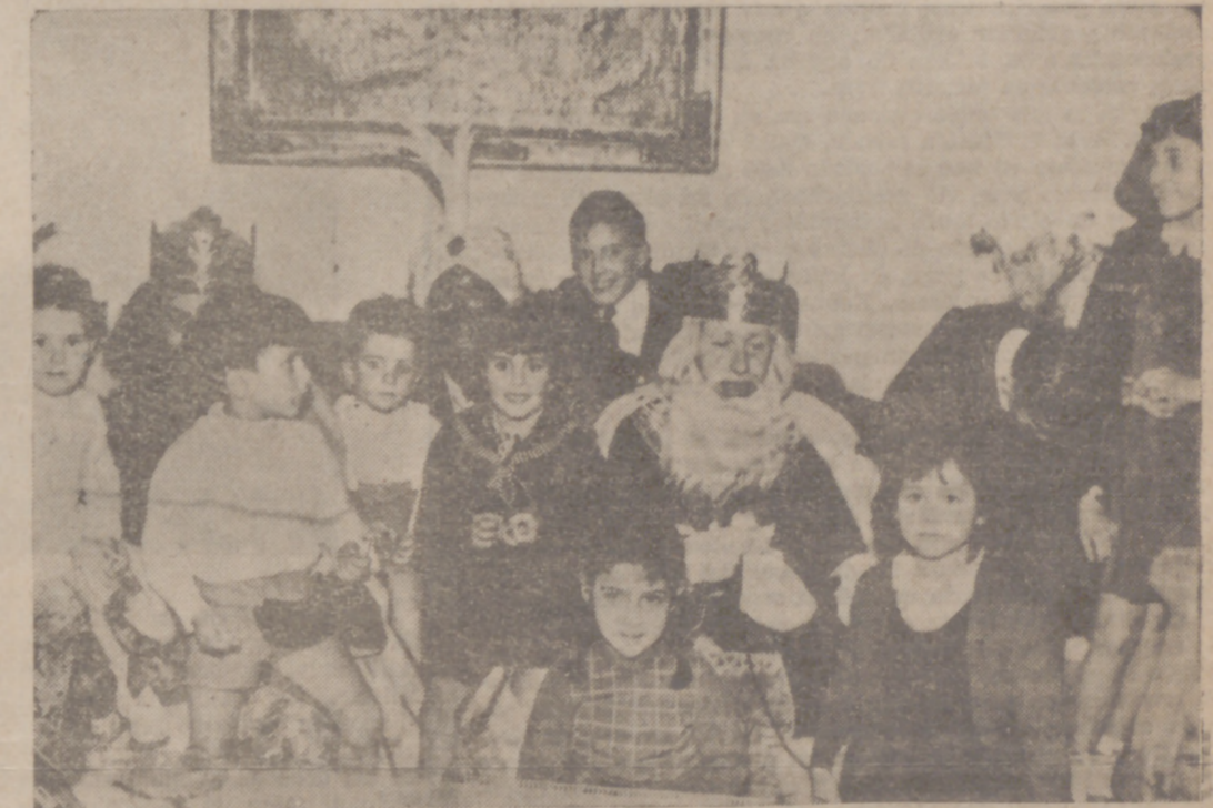
Los Reyes Magos a su llegada a la casa del Alcalde de Valladolid, donde sus hijos esperaban llenos de alegría.