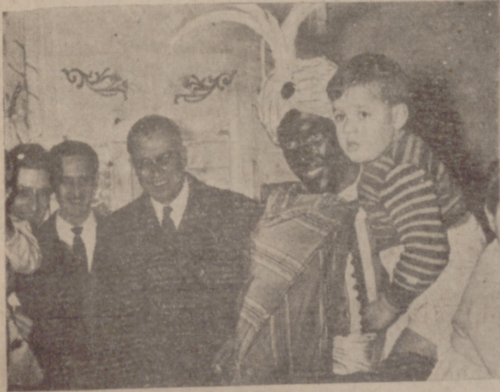
LA VISITA AL PATRONATO.