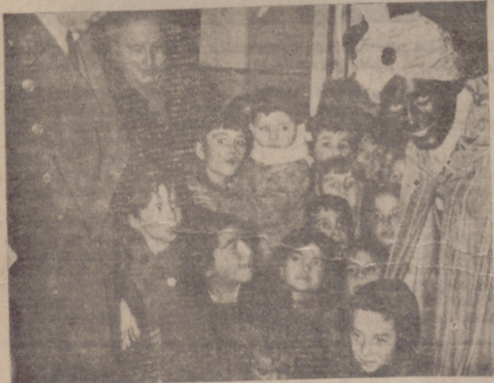
LOS REYES LLEGAN A LA PRISION.

La Jefatura Provincial del Movimiento y la Delegación Provincial del Frente de Juventudes organizaron la caravana de Reyes Magos que habría de llevar hoy a los centros benéficos y a los presentes destinados a los niños acogidos a los mismos.