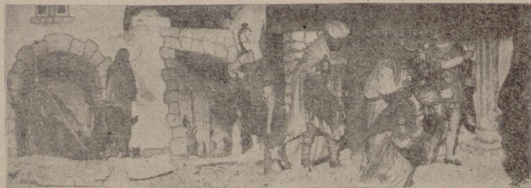
Belén de «Grupos Escolares», montado en el Grupo «González-Regueras», del Patronato «San Pedro Regalado», primer premio de los de esta clase.

En el salón de actos de la Central Nacional-Sindicalista se han verificado las elecciones de segundo grado del Sindicato Provincial de Frutos y Productos Hortícolas habiendo resultado elegidos los siguientes: