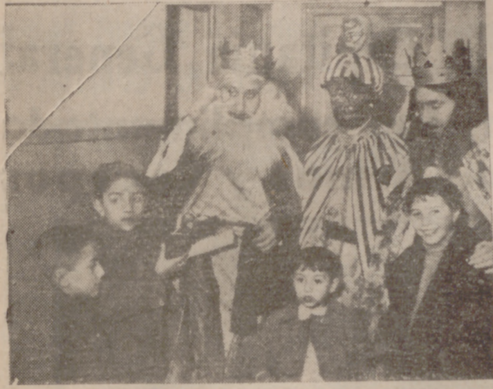
Los Reyes repartiendo los juguetes—en la Casa Sindical—de la Obra «Educación y Descanso».

El Jefe Provincial, el Subjefe Provincial y el Delegado del Frente de Juventudes, acompañaron a la caravana