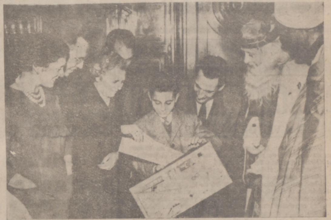
Los Reyes Magos durante su visita a los hijos del Gobernador Civil y Jefe Provincial del Movimiento.