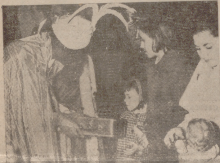
EN LA SECCIÓN FEMENINA.