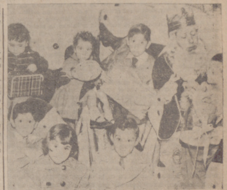
Los Reyes Magos en el domicilio del Delegado Provincial del Frente de Juventudes.

Los hijos de estas jerarquías recibieron a los Soberanos de Oriente con inmensa alegría e ilusión, que aumentaron con los valiosos juguetes recibidos.