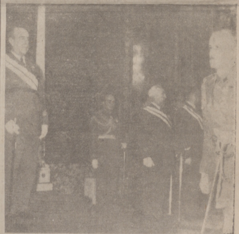
Uno de los momentos de la recepción: el Capitán General en el salón del Trono presencia el paso de los jefes y oficiales.

neral, Estado Mayor y Jefatura de Servicios, Ala número 3, Agrupación de Tropas de Aviación y Grupo de Artillería Antiaérea; Cuerpo de Inválidos y Mutilados de Guerra; Armas de Infantería, Caballería, Ingenieros, Ingenieros de Armamento y Construcción, Guardia Civil, Cuerpo Jurídico, Gobierno Militar y Subinspección, Intendencia, Intervenciones, Sanidad, Veterinaria, Farmacia, Cuerpo de Oficinas Militares, Clero Castrense, Automovilismo, Servicios