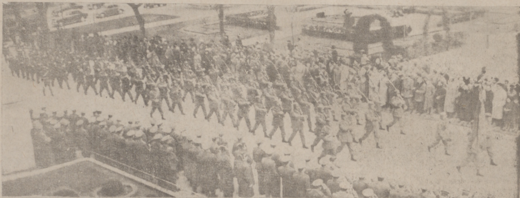
LA COMPAÑIA DE HONOR DESFILE DELANTE DE CAPITANIA.

Con gran brillantez se celebró esta mañana la Pascua Militar Solemne recepción en el Palacio de Capitanía General La primera autoridad de la Región, fué cumplimentada por generales, jefes y oficiales de Armas y Cuerpos