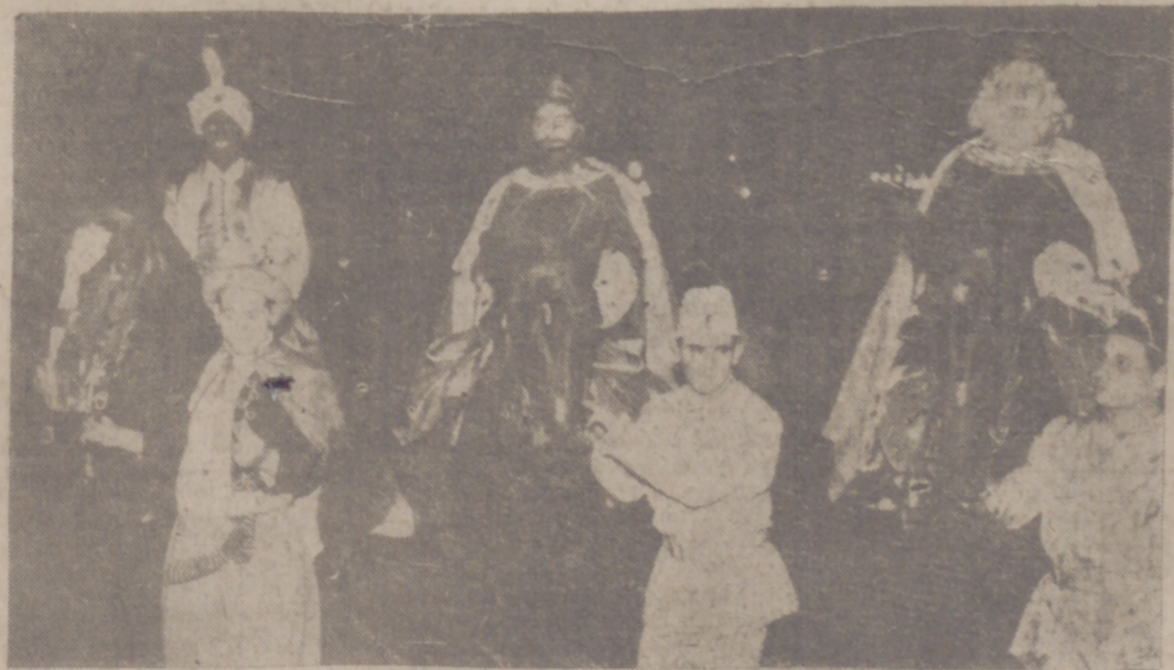
Los majestuosos Reyes de Oriente, desfilando por nuestra ciudad.

Miles de niños contemplaron la vistosa comitiva que recorrió el centro de la capital