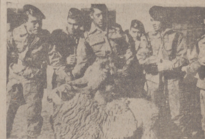
La Pascua Militar se celebra este año bajo el signo de la heróica lucha en Ifni por nuestra soberanía.