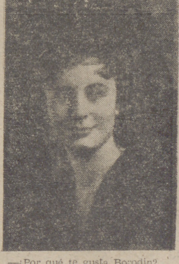
¿Por qué te gusta Borodin? —Una de las composiciones que más me agradan es la ópera de "El Principé Igor".

Ayer noche, aparte del sorteo ordinario del día en el que, como todos los días pares, puede elegirse entre la batería de cocina de aluminio de lujo, o la olla exprés, o la bicicleta, o la pieza de tela de sábanas, se celebró el tercer sorteo extraordinario entre las papeletas ya totalmente vendidas, con números para el mismo y con los siguientes premios: 1.º Una moto scooter "Vespa". 2.º Una pieza de tela de sábana de 25 metros. 3.º Una vajilla de 30 piezas. 4.º Un jamón serrano.