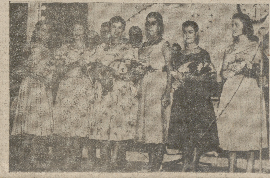
Las dos Reinas, entrante y saliente, con las damas de honor, posan para nuestro diario en el marco de la Pergola.